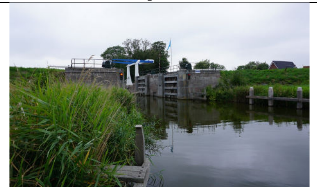
Zicht op het buitenhoofd