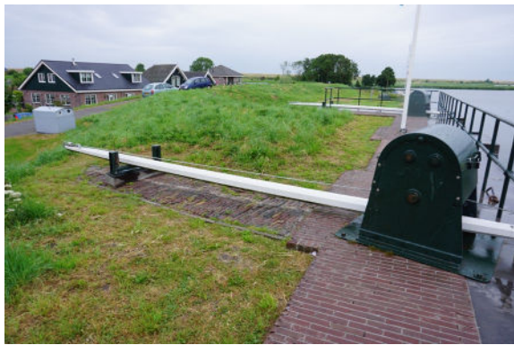
Twee van de windwerken