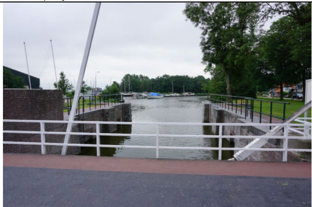
Zicht vanaf brug naar binnenhoofd