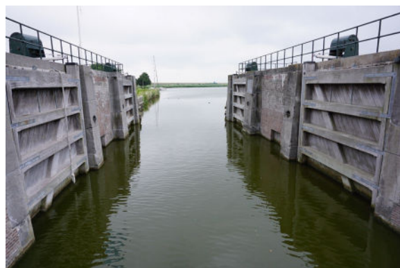
Zicht vanaf brug naar buitenhoofd