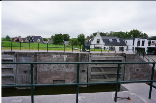
Zicht naar zuidoostelijke sluiswand buitenhoofd