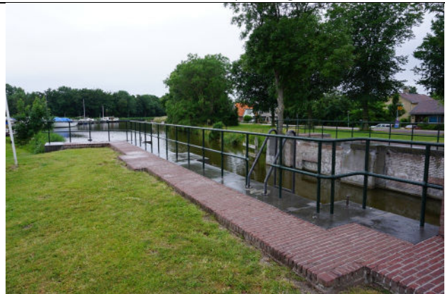
Deel van reling