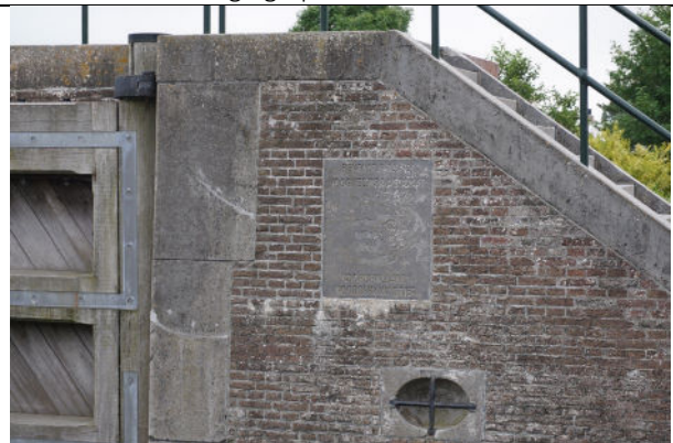
Herdenkingssteen 1983 boven ovalen haalkom