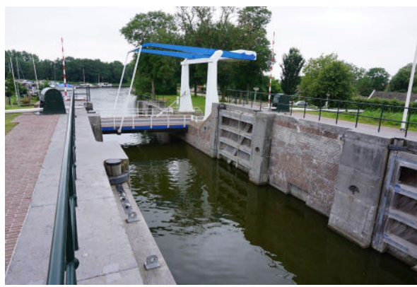
Zicht vanaf buitenhoofd naar binnenhoofd