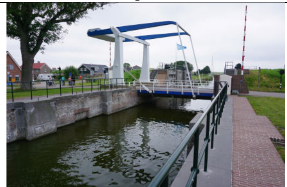
Zicht vanaf binnenhoofd naar buitenhoofd