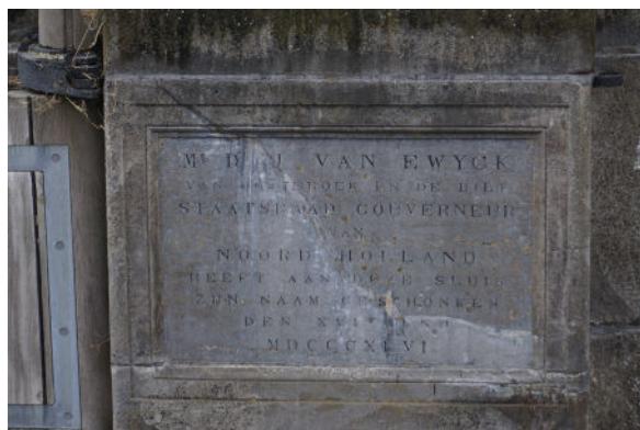
Steen met inscriptie uit 1846