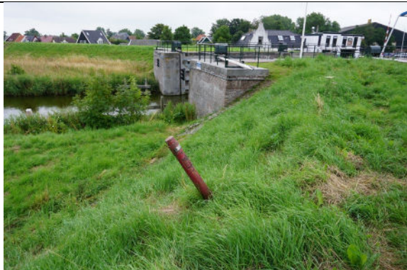
Zicht op buitenfront