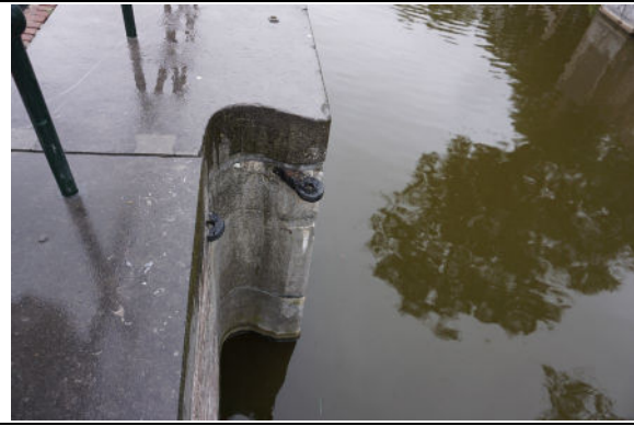
Bevestigingsogen voor halsbeugel van sluisdeuren