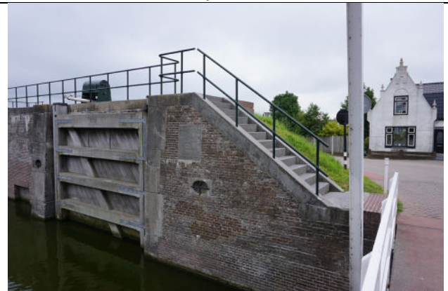
Trap bij middenhoofd met een van de sluisdeuren