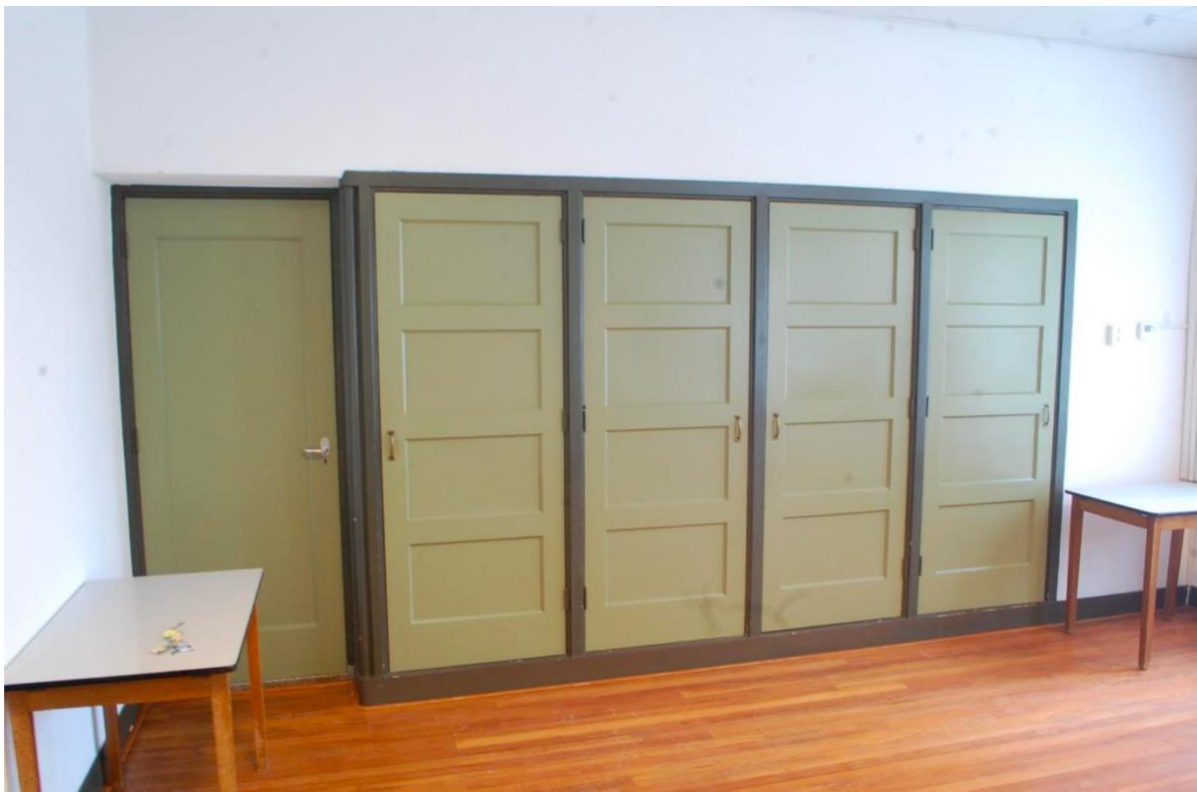
Houten paneeldeuren in het vergaderlokaal.

Via de hoofdingang komt men direct uit in de vestibule. Aan de rechterkant geven twee entreedeuren toegang tot de kerkzaal. De houten lambrisering en de houten kapconstructie is nog intact en zichtbaar. De vorm van de dakspanten zien we omgekeerd terug in het herdenkingsmonument voor Catrinus Douma en symboliseren de V van verzet tegen onrecht en de keuze die Catrinus en andere maakten om in het verzet te gaan. De kerkzaal is aantal jaar geleden opnieuw ingericht waarbij het altaar is verplaatst en de kerkbanken verwijderd. Bij recente verbouwingen is de hele vloer vernieuwd en vloerverwarming aangebracht. Het orgel is nog aanwezig en gebouwd door T. Strunk in 1940. Twee deuren aan weerszijden van het orgel geven toegang tot de toiletten en consistorie (voorheen kerkraadkamer).