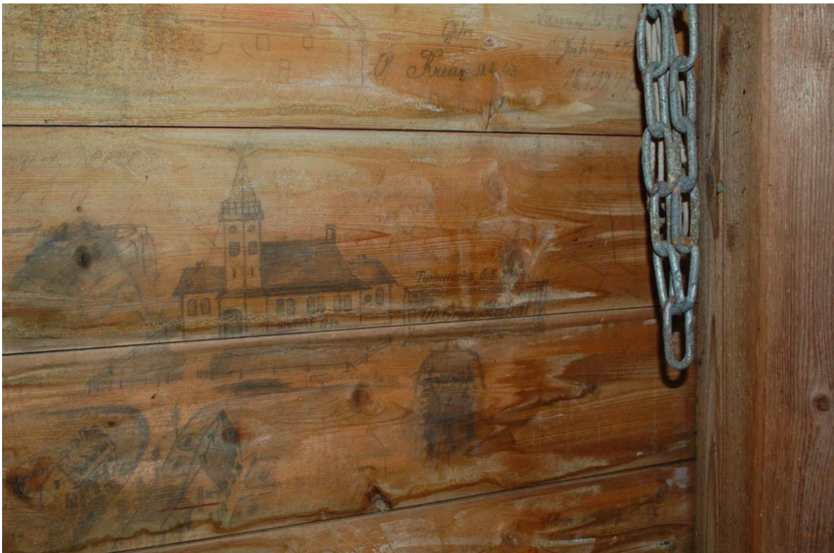
Duitstalige opschriften en tekeningen aan de binnenkant van de torenspits