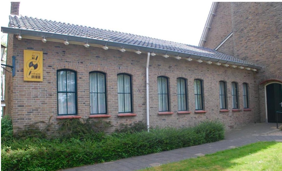
Voorgevel 1 (west): vergaderlokaal

De gevels worden afgesloten door de witgeschilderde spantbenen van het dakoverstek en een zinken mastgoot.