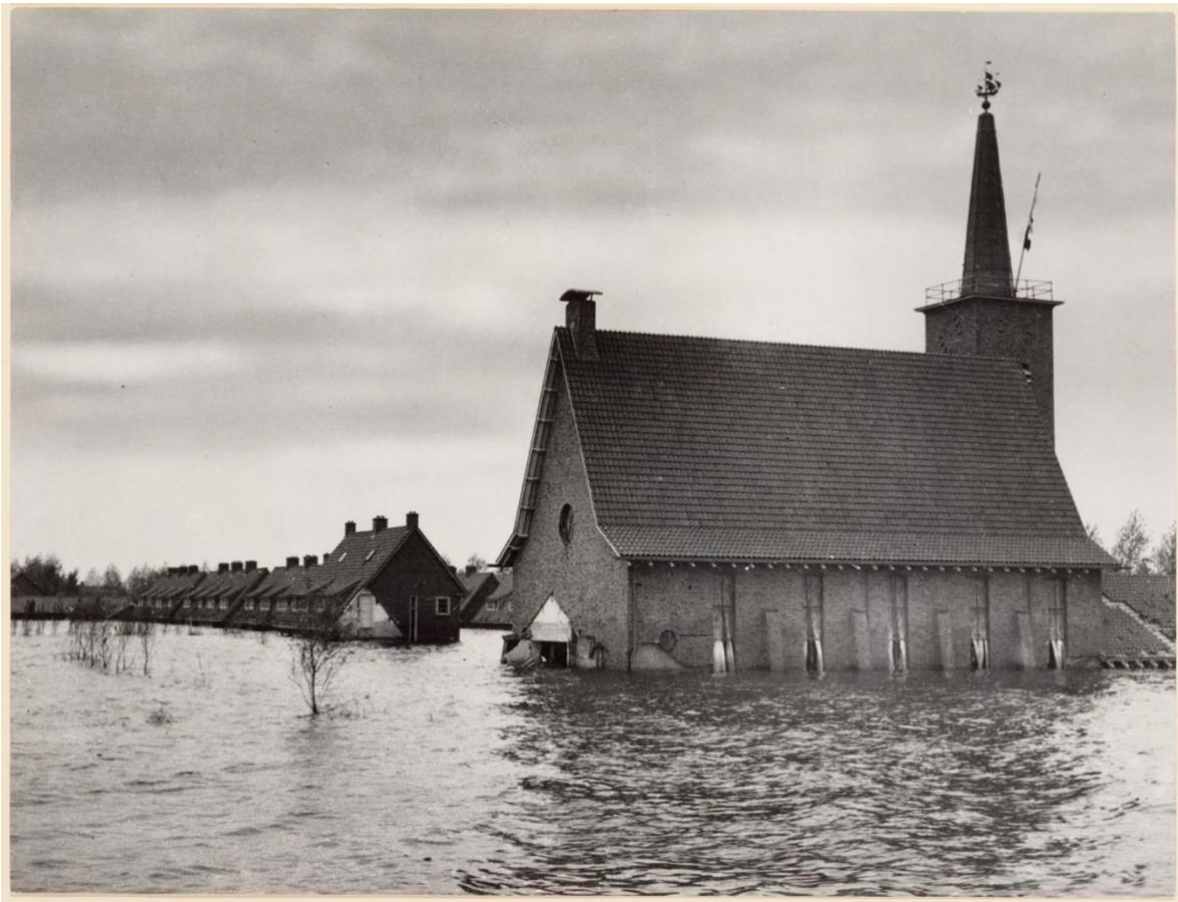
De Gereformeerde kerk in 1945 tijdens de inundatie door de Duitse bezetter.