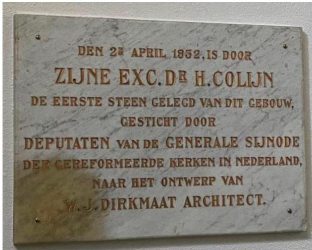
Eerstesteenlegging van de voorganger en de klok.