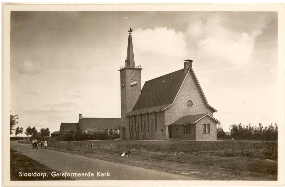
Historische foto van de Gereformeerde kerk in Slootdorp. Datum onbekend.