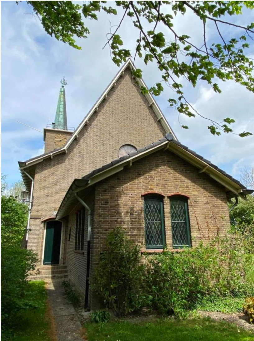
Rechterzijgevel (zuid): consistorie en kerkzaal

De rechterzijgevel van de consistorie bezit twee getoogde houten vensters met een horizontale roede en een invulling van glas-in-lood in ruitvorm. De vensters hebben aan de onderzijde terracotta lekdorpelstenen en aan de bovenzijde terracotta tegels. Links en rechts van de consistorie bevindt zich een toegangsdeur naar de kerkzaal bereikbaar via een bordes bestaande uit drie gemetselde traptreden. De entree bestaat uit een houten deur met verticale profilering. De uitgemetselde dagkanten lopen taps toe en boven de entree is in het metselwerk een spaarboog aangebracht. De onderzijde van de spaarboog is bedekt met terracotta tegels. In de topgevel van de kerkzaal zit een rond venster met glas-in-lood invulling. De topgevel wordt gesloten door een houten overstek.