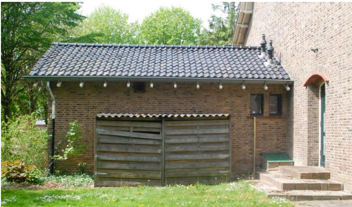
Achtergevel 1 (oost): consistorie

De achtergevel valt, net als de voorgevel, op te delen in drie onderdelen (van links naar rechts): de vergaderkamer, de kerkzaal en de consistorie. De gevel van de consistorie ligt iets terug ten opzichte van de kerkzaal en is grotendeels gesloten uitgevoerd behoudens de twee kleine houten rechthoekige vensters met terracotta lekdorpelstenen geheel rechts in de gevel. Tegen de consistorie staat een houten schuurtje met een golfplaat afdekking. De achtergevel van de kerkzaal is in vijf traveeën gedeeld door vier uitgemetselde steunberen. Ieder travee is ingevuld met een drieruits getoogd venster met glas-in-lood-invulling in ruitvorm. De vensters worden afgesloten door terracotta tegels. Geheel rechts zit een klein rond venster met vierruits indeling en glas-in-lood-invulling. De gevelindeling van de vergaderkamer bestaat uit vijf kleine houten rechthoekige vensters met terracotta raamdorpelstenen. In het achterdakvlak van de vergaderzaal is ter hoogte van de vestibule recent een nieuwe vierruits dakkapel met een zadeldakje geplaatst. De gevels worden afgesloten door de wit geschilderde spantbenen van het dakoverstek en een zinken mastgoot.