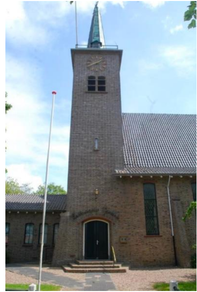
Voorgevel 2 (west): entree, klokkentoren en kerkzaal