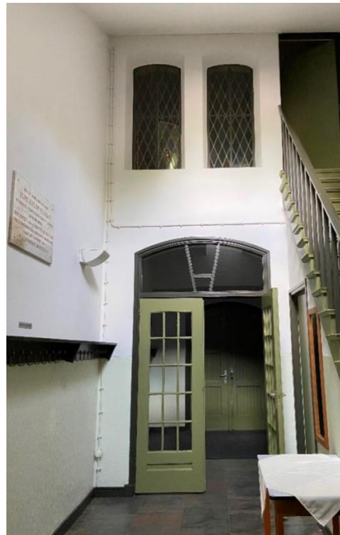
Kerkraam en trap naar de klokkentoren in de vestibule.