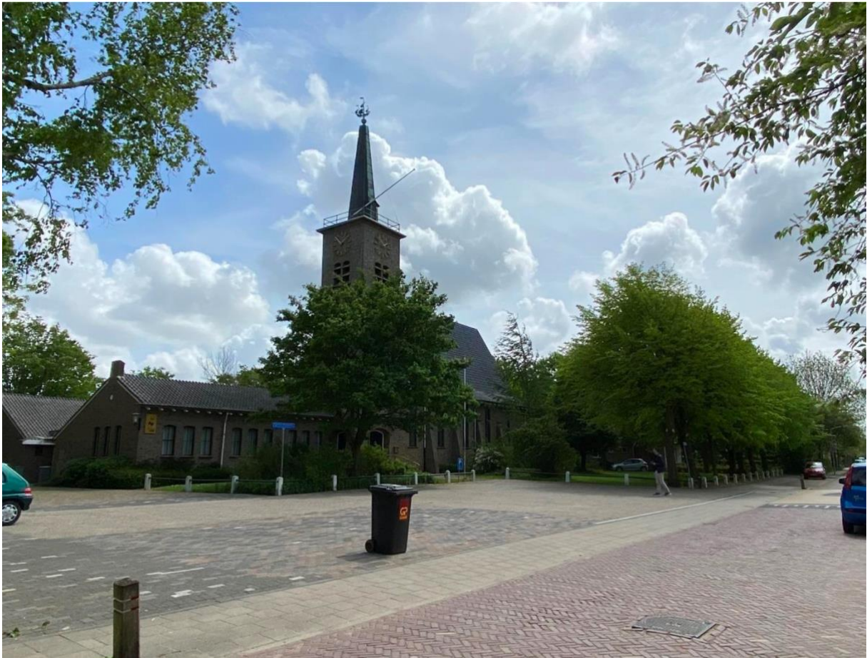
De kerk in zijn omgeving. Voor de kerk ligt het kerkplein en de toren staat in het verlengde van de Kerkstraat.