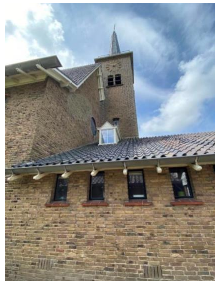
Achtergevel 2 (oost): kerkzaal en vergaderkamer