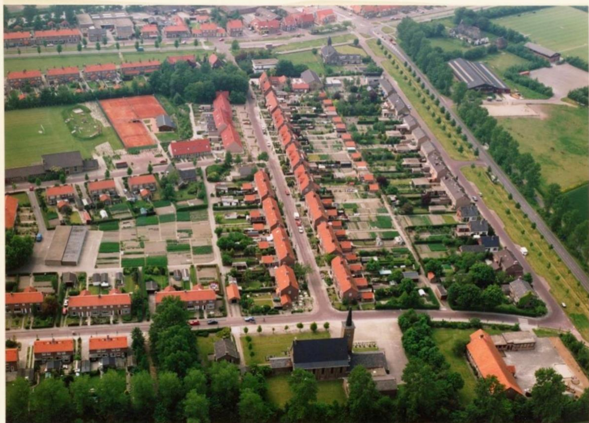
Luchtfoto Slootdorp 1990 met basisschool De Zaaier rechtsonder