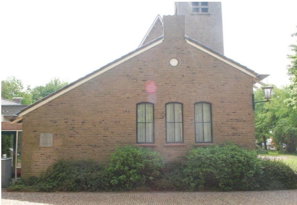
Linkerzijgevel (noord): vergaderlokaal.

De linkerzijgevel van het vergaderlokaal heeft een asymmetrische gevel met een tuit. Geheel links zit een plaquette ter nagedachtenis aan de verzetsstrijders die in de kerk bijeenkwamen tussen 1943-1944. Rechts daarvan zitten drie getoogde vensters met vierruits indeling. In de topgevel zit een ronde gevelopening die is dichtgezet. Op de rechterhoek hangt een lantaarn. Rechts van de vergaderkamer, in de linkerzijgevel van de kerkzaal, bevindt zich een entree met hellingbaan naar de kerkzaal onderaan de klokkentoren. De entree bestaat uit een houten deur met verticale profilering. De uitgemetselde dagkanten lopen taps toe en boven de entree is in het metselwerk een spaarboog aangebracht. De onderzijde van de spaarboog is bedekt met terracotta tegels. In de topgevel van de kerkzaal zit een rond venster met glas-in-lood invulling. De topgevel wordt gesloten door een houten overstek.