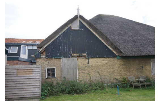
Aangekapt deel bij koeienstal