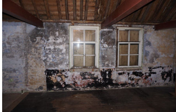
Twee zesruits vensters, zuidgevel