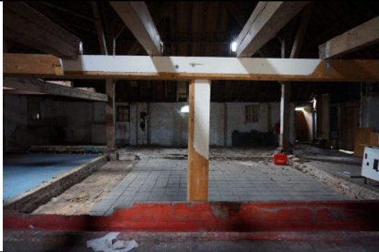
Interieur, vanuit koeienstal over vierkant naar dars