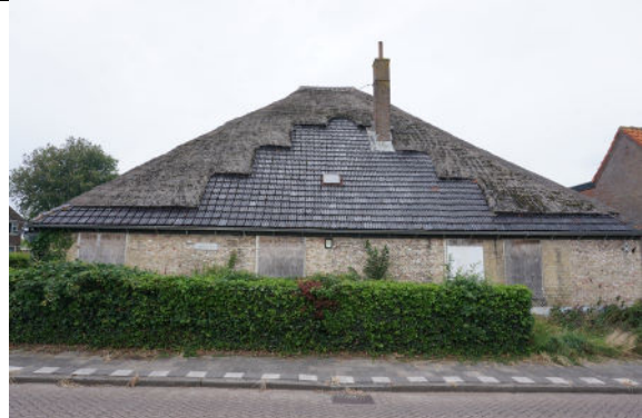
Spiegel aan voorzijde (Hofstraat)