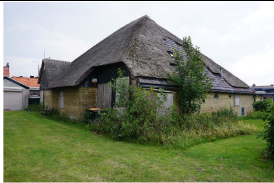
Achtergevel (links) en westgevel (rechts)