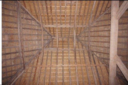
Interieur, zicht op nok van kap