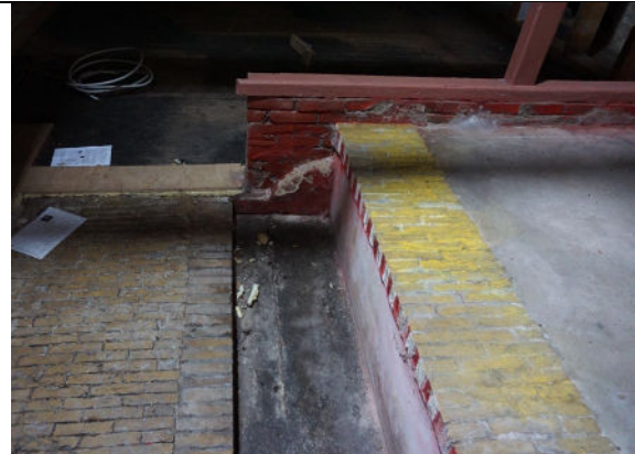
Een detail van de koestand met grup