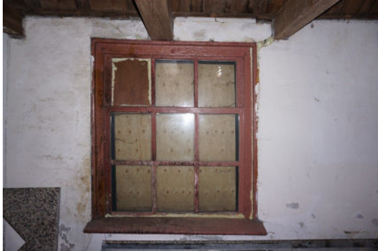
Een negenruits venster, oostgevel