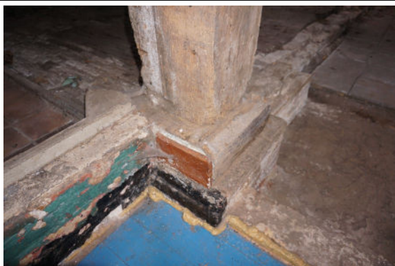
Een van de gebintstijlen met poer