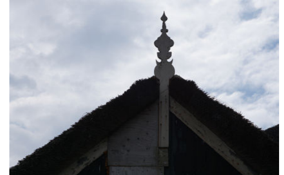
Makelaar bij aangekapt deel