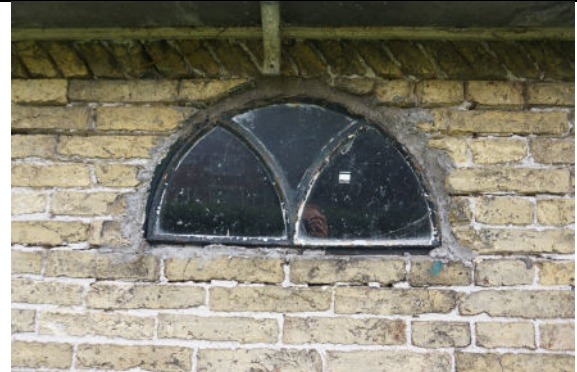
Stalraam en schuine strek in westgevel