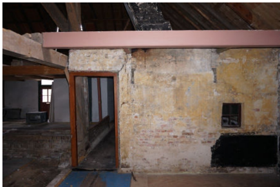
Gemetselde muur met bovendee van schoorsteen