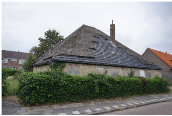
gevel aan Hofstraat (voorgevel)