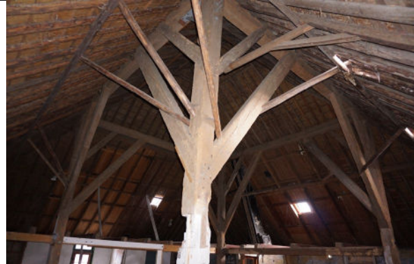
De gebintstijlen met verstijvingen