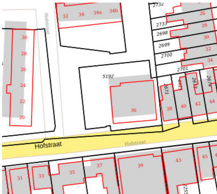
Kaart kadastrale situatie (juli 2019)