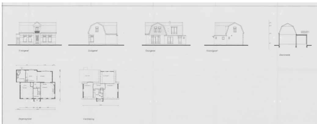
Bouwtekeningen uit 1995 met daarop de bestaande en nieuwe situatie.