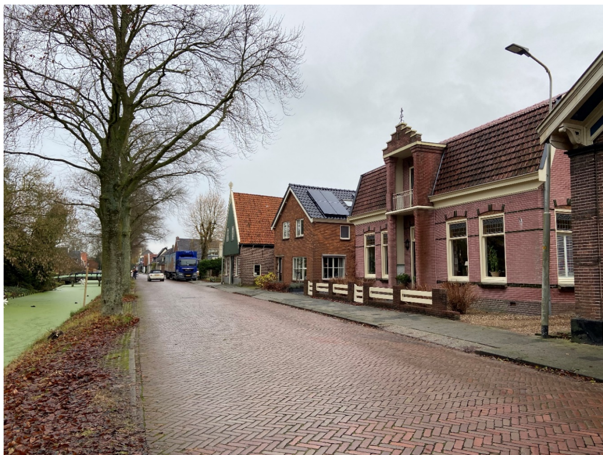
Het pand aan de Dorpsstraat 125 in zijn omgeving.

Het pand staat voorop de langgerekte kavel. Aan de voorzijde (noord) ligt een ondiepe voortuin ingevuld met grind. De voortuin wordt van het voorliggende trottoir afgescheiden door een laag houten hekwerk tussen gemetselde penanten. Aan de linkerzijde (oost) ligt een smalle strook grind. Aan de rechterzijde (west) bevindt zich de oprit. Aan de achterzijde (zuid) ligt de tuin met uitzicht op het open weidelandschap. Aan de achterzijde is een terras ingericht met overkapping en staat een bijbehorend bouwwerk.