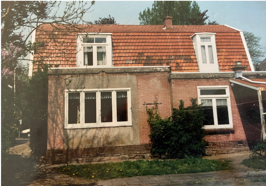
De voor- en achtergevel in 1990.