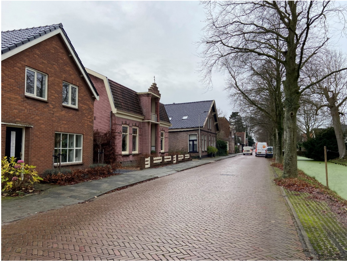
Het pand aan de Dorpsstraat 125 in zijn omgeving.