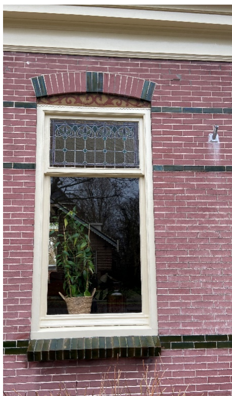
Detailfoto's van de voordeur en het raamkozijn.