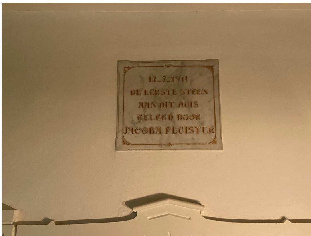
Eerste steenlegging in de gang.