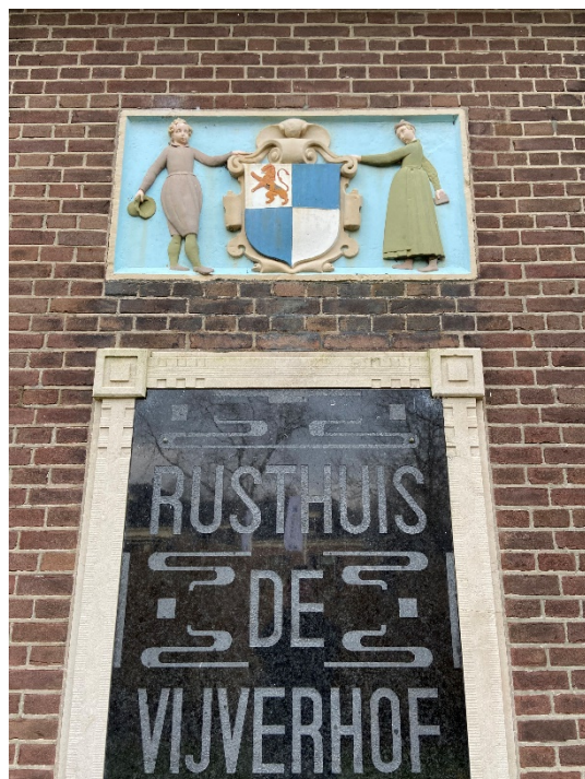
De voorgevel met enkele detailfoto's.