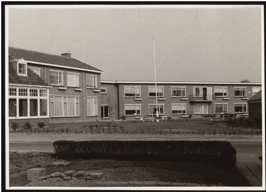
Historische foto van het Rusthuis, waarvan geheel links alleen de serre zichtbaar is, met de in 1968 aangebouwde vleugel. Datum 1972.