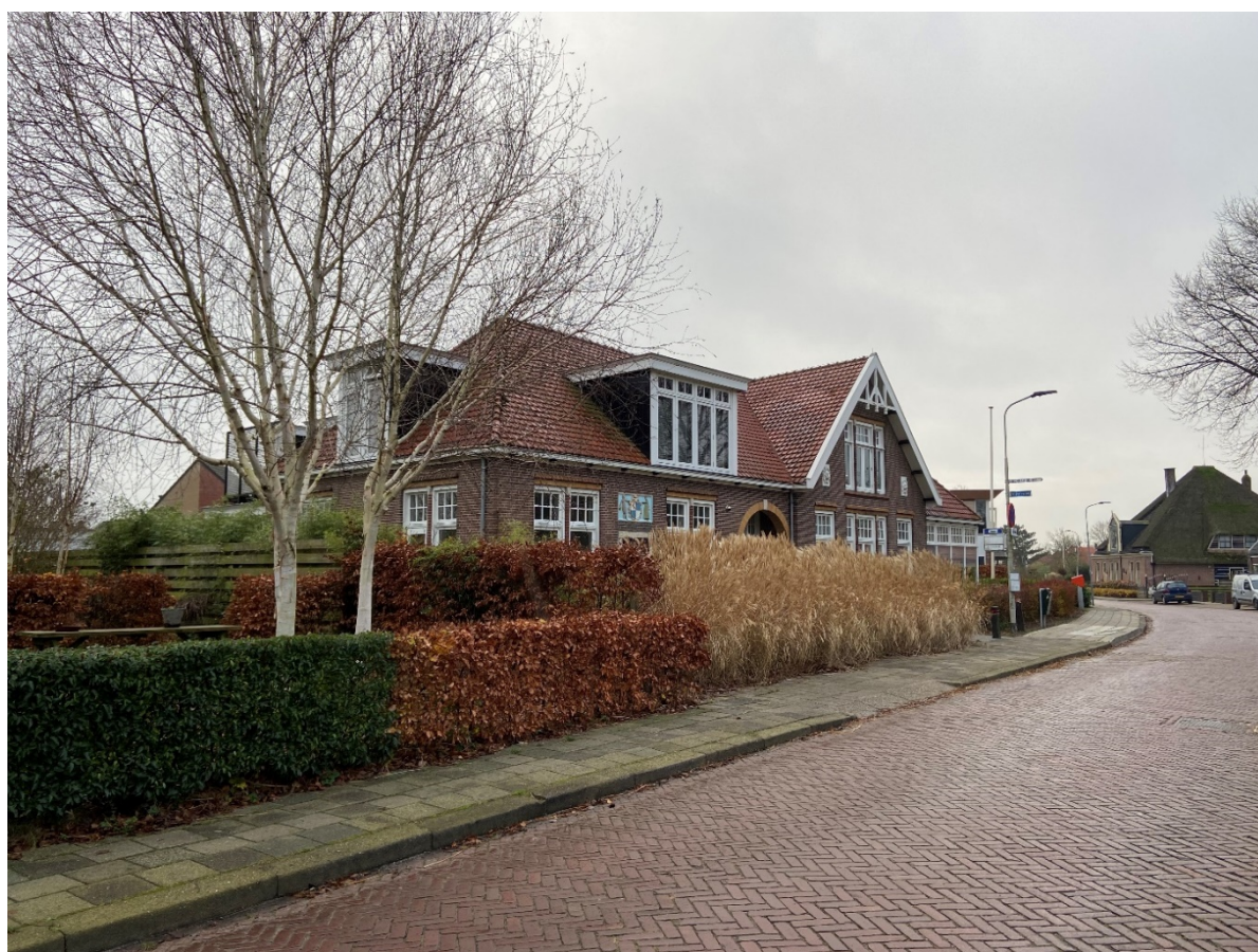
Dorpsstraat 265 t/m 279 in zijn omgeving.

Het pand bevindt zich aan de noordzijde van een driehoekige kavel waarvan de scherpe hoek in oostelijke richting wijst. Aan de voorzijde van het pand (noord) bevindt zich een ondiepe voortuin. Een hardstenen pad biedt toegang tot de entree deur. Links (oost) van het pand bevindt zich een smalle groenstrook, afgeschermd van het naastgelegen perceel door een houten schutting. Aan de rechterzijde (west) van het pand bevinden zich de terrassen van de appartementen afgeschermd door een beukenhaag en houten hekwerk. Aan de achterzijde (zuid) grenst het pand aan een parkeerplaats.