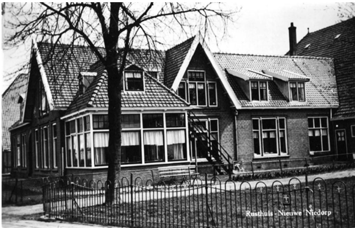
Historische foto van het Rusthuis met de aangebouwde serre. Datum 1940