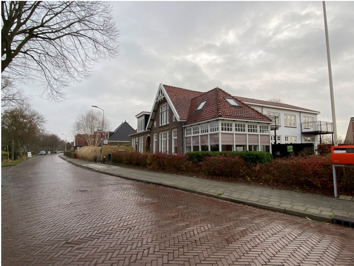
Dorpsstraat 265 t/m 279 in zijn omgeving.