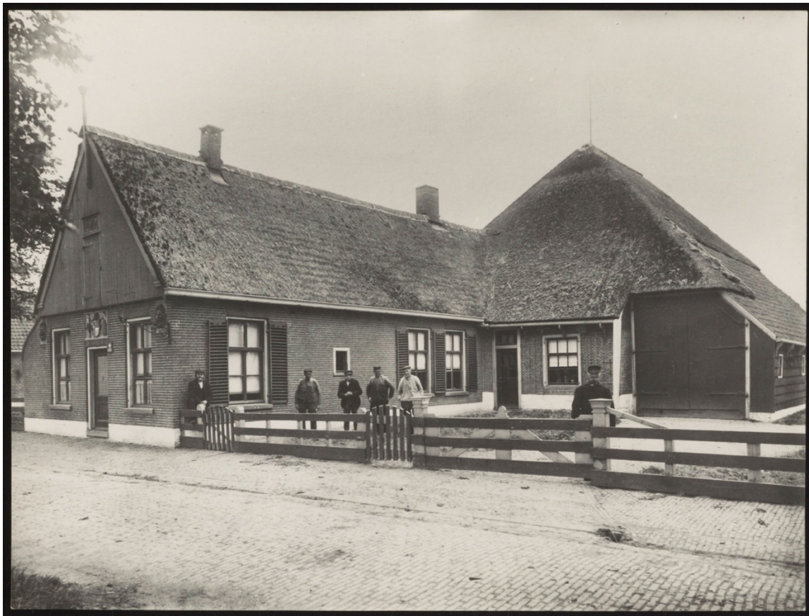
Historische foto van het Algemeen Armenhuis, datum 1906. Aan de straatkant het woonhuis met daarachter de gemeenteboerderij. In de voorgevel zijn de twee leeuwenkopmaskers en de gevelsteen met het wapen van Niedorp vastgehouden door twee wezen zichtbaar.