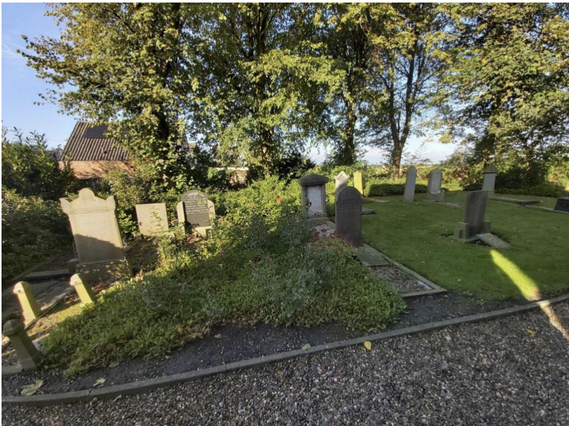
De ruïnekerk in zijn omgeving.