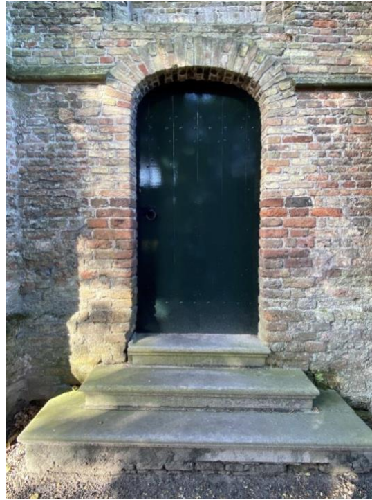
De achtergevel en een detailfoto van de deur.