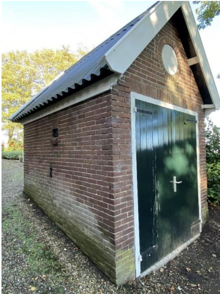
De berging op de begraafplaats.