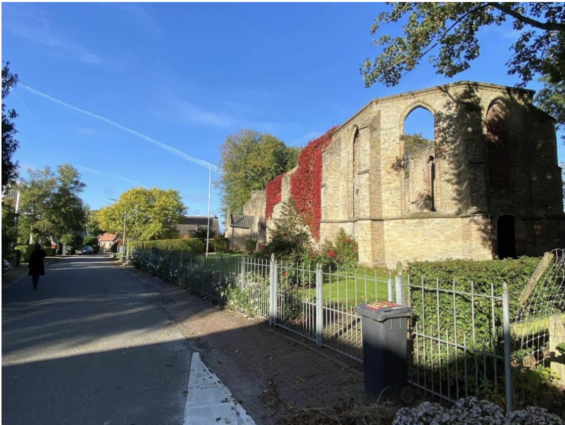
De ruïnekerk in zijn omgeving.

De ruïnekerk is gelegen op een terp met aan de noord- en westzijde de gemeentelijke begraafplaats. De begraafplaats is in de vorige eeuw in noordelijke richting uitgebreid waardoor het natuurlijke aspect van de terp grotendeels verloren is gegaan. Aan de noordzijde van de ruïnekerk staat een berging bestaande uit één bouwlaag met zadeldak. De gevels zijn opgetrokken in baksteen en het dak wordt bedekt met golfplaten. De voor- en achtergevel worden afgesloten door een overstek met waterbord/windveer. In de voorgevel zit een dubbele deur met daarboven een dichtgezet rond venster. In de achtergevel zit ook een rond venster. De zijgevels zijn gesloten. De kavel wordt aan de noord, oost en westzijde omsloten door een bommenrij, aan de zuidzijde wordt de kavel afgesloten door een smeedijzeren hekwerk langs de straat.