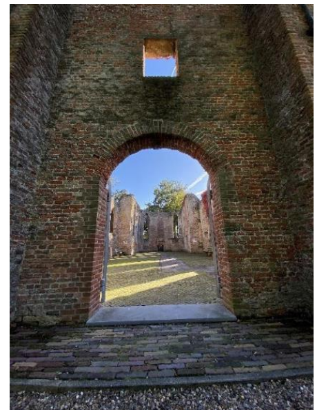
De voorgevel en een doorkijk door de voormalige entree