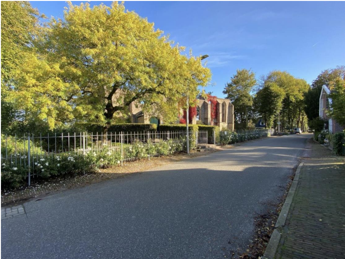
De ruïnekerk in zijn omgeving.