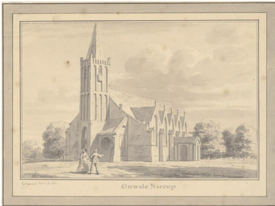
Prent van de kerk van Oude Niedorp met zijbeuken, datum begin 1700.