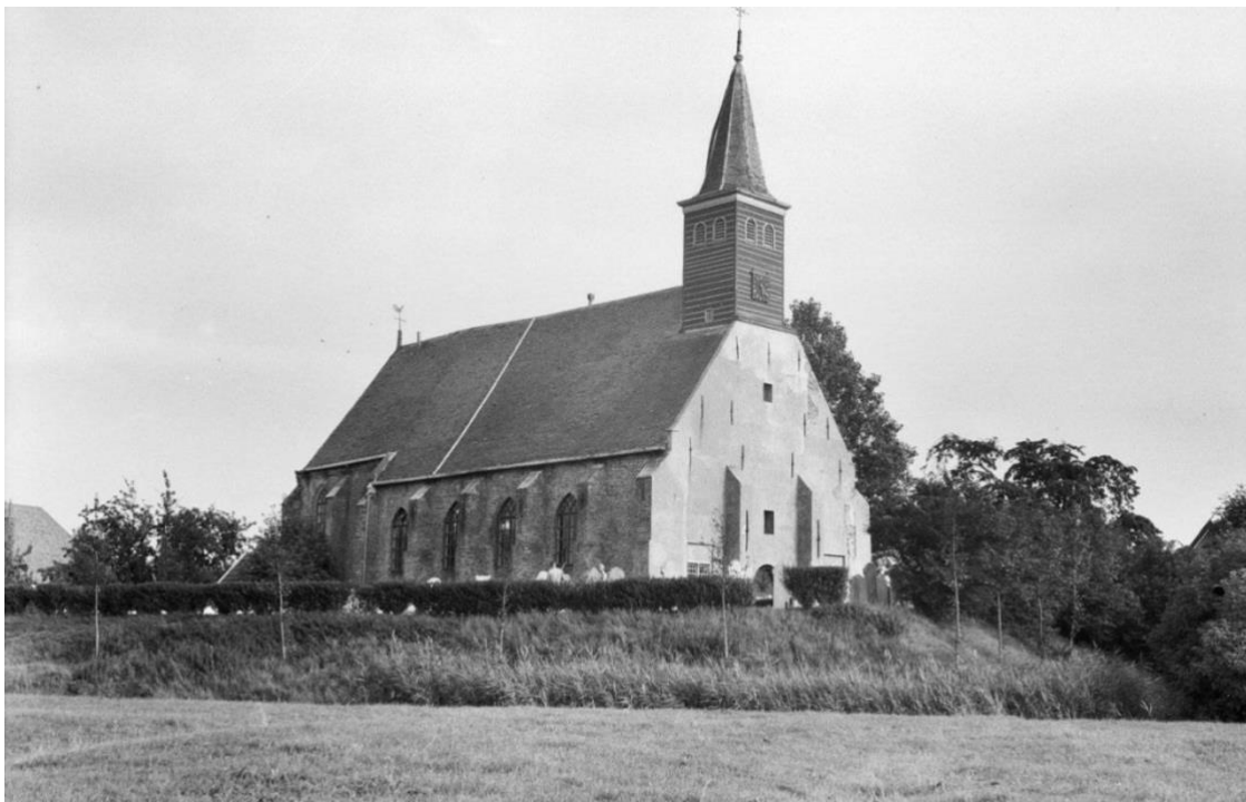
Historische foto van de kerk van Oude Niedorp met de houten toren aan de westzijde, datum 1949.