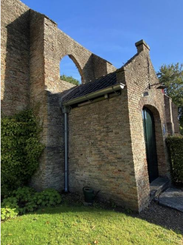
De rechterzijgevel en zijingang