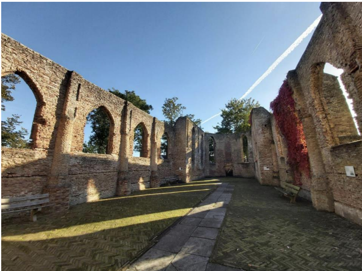
Impressie van het interieur. Onder andere zijn te zien: de ingemetselde zuilen, de restanten van de houtconstructie, de grafzerken en de contouren van de preekstoel.

Het volledige interieur is verloren gegaan bij de brand naar aanleiding van de blikseminslag. De vloer is opnieuw bestraat. In het straatwerk is de oorspronkelijke locatie van de preekstoel aangegeven. Tevens zijn in het straatwerk enkele originele grafzerken van Belgisch kalksteen teruggeplaatst, daterend uit de 16 e tot 19 e eeuw. De zuilen die zijn opgebouwd eind 15 e eeuw toen de kerk werd uitgebreid met twee zijbeuken zijn nog zichtbaar en ingemetseld in de bestaande zijgevels. De beide rijen met zuilen ondersteunden de muren die de hoofdkap droegen en die tevens als scheiding tussen schip en zijbeuken dienden. Toen de zijbeuken uiteindelijk weer werden afgebroken zijn de ruimtes tussen de zuilen dichtgemetseld. Verder zijn nog enkele restanten hout van de voormalige constructie zicht en zijn in enkele zuilen nog inkepingen zichtbaar van waar de houtconstructie heeft gezeten. In de ruïnekerk hangen informatieborden en staan twee bankjes. Langs de voorgevel is in 2011 een trekstang aangebracht.