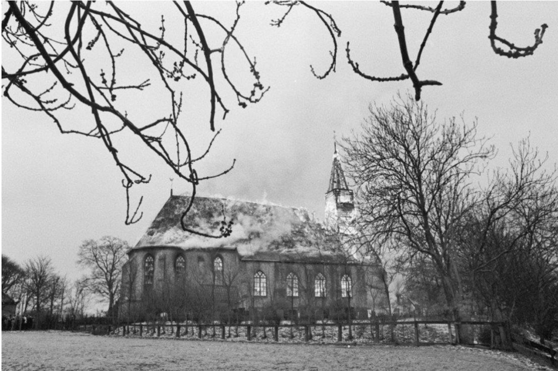
Historische foto van de kerkbrand, datum 3 april 1977.