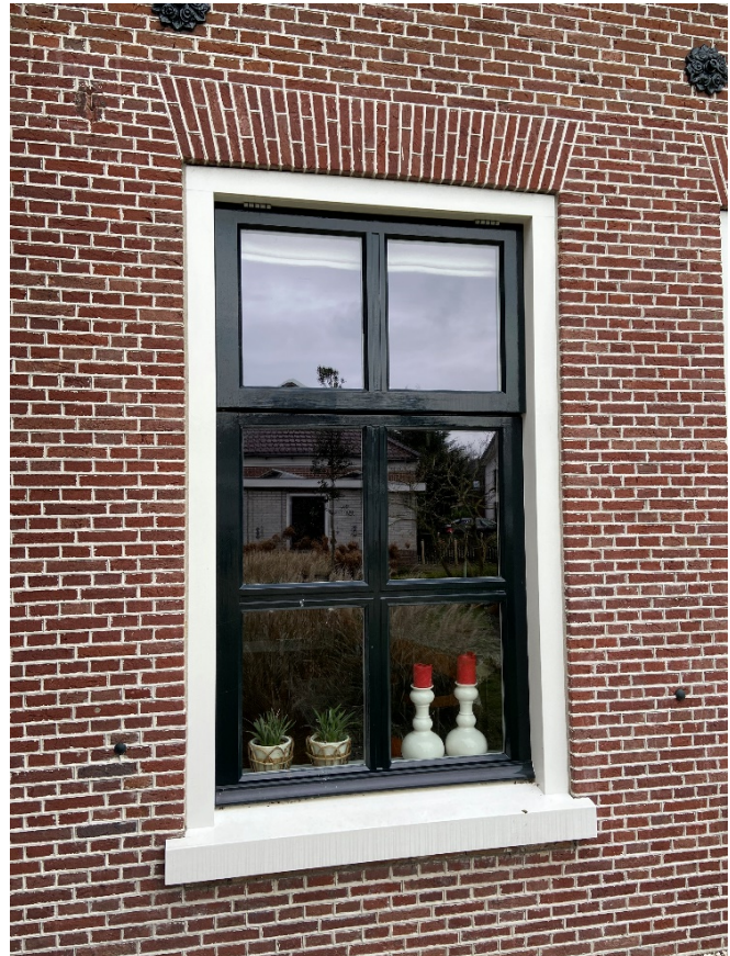
Enkele detailfoto's met voorgevel.