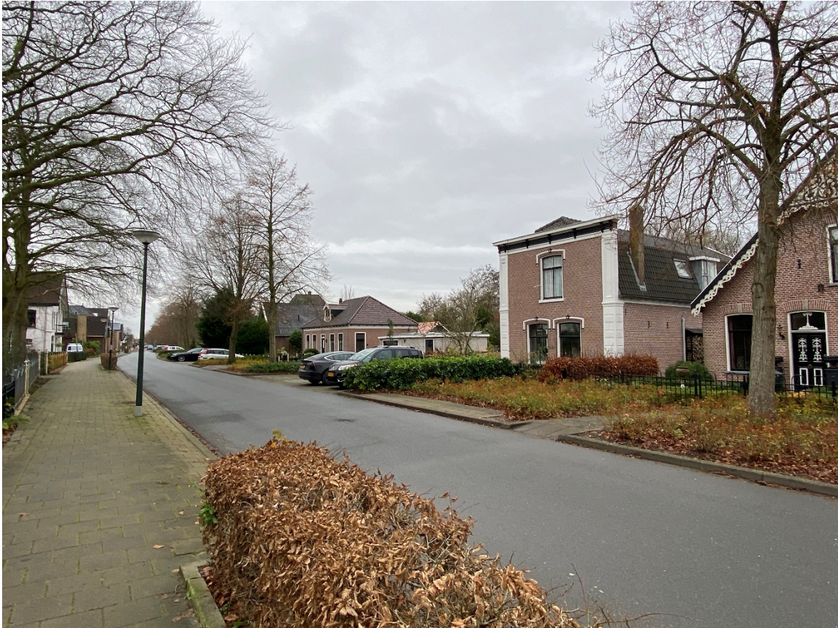
Dorpsstraat 63 in zijn omgeving