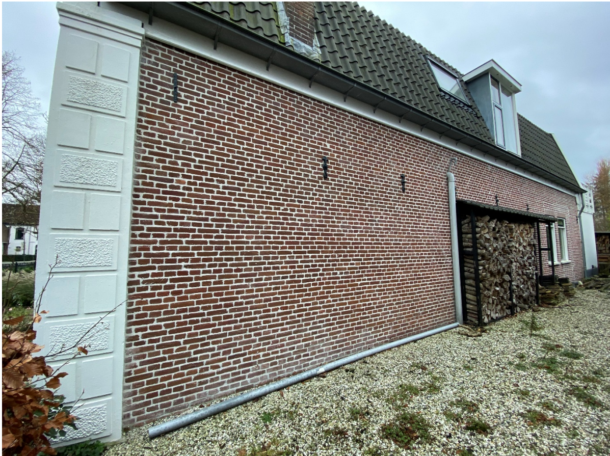
De rechterzijgevel met een detailfoto.

In de gevel zitten zeven muurankers, waarvan één schietanker en de overige zijn uitgevoerd in de vorm van een Franse lelie. De gevel wordt afgesloten door een houten kantplank met daarboven een koperen bakgoot. In het dakvlak staat een gemetselde schoorsteen opgetrokken uit roodbruine baksteen in halfsteens verband. Rechts van de schoorsteen is een dakraam geplaatst met daarnaast een plat afgedekte dakkapel.