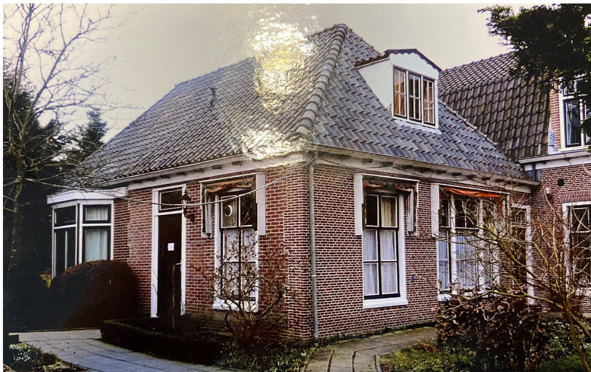
Een foto uit 2012 van het linkerbouwdeel waarin de dokterspraktijk was gevestigd. Rechts op de foto is nog een gedeelte van het rechterbouwdeel te zien en in de oksel van beide bouwdelen bevindt zich nog de voordeur.