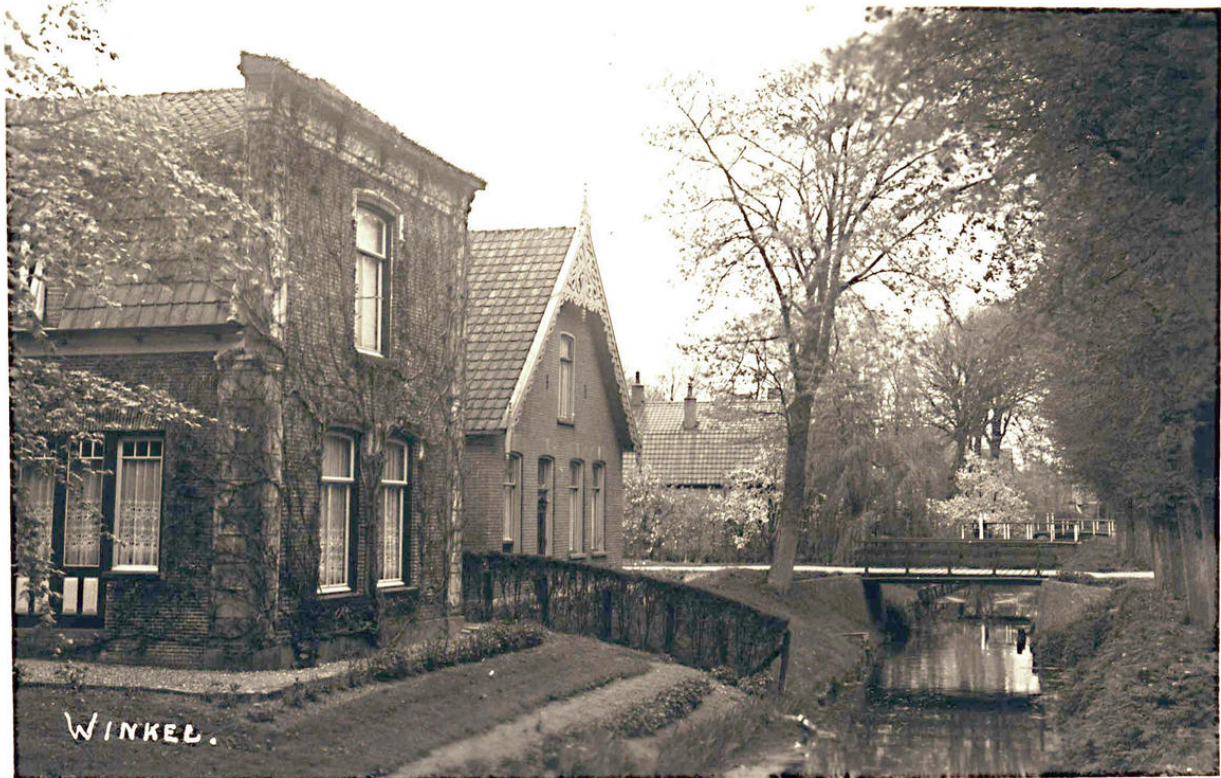
Historische foto Dorpsstraat 83. Datum 1939.