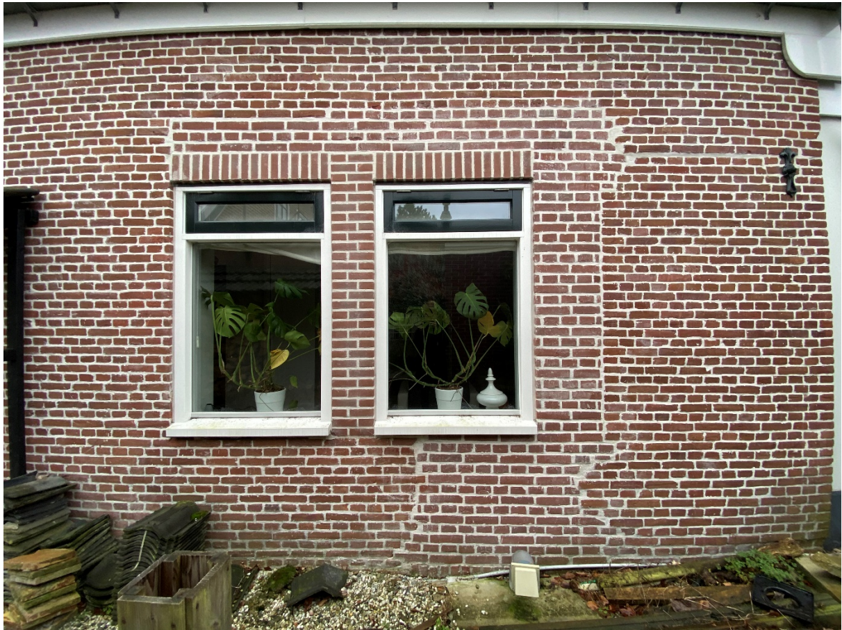
De rechterzijgevel met een detailfoto.