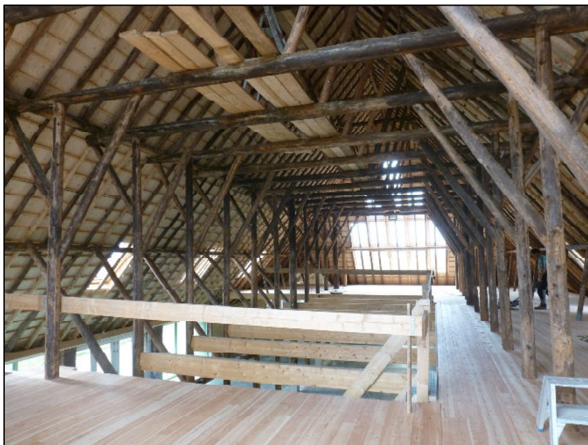
Kap richting voorgevel (ZW)