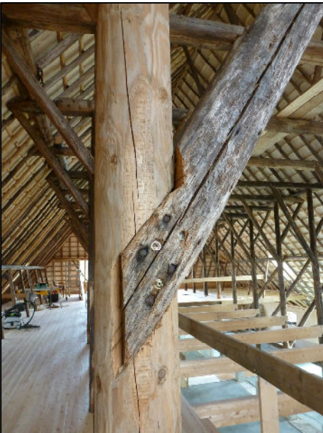
Detail oude en nieuwe nagels ter versteviging