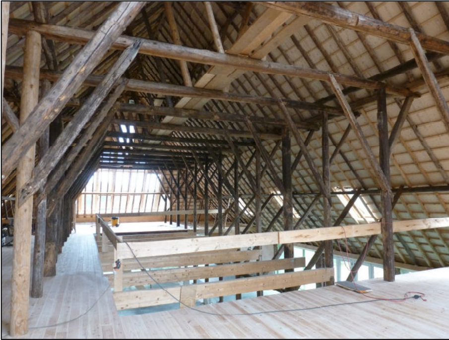
Kap richting achtergevel