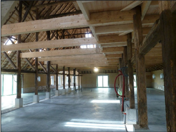
Interieur richting voorgevel