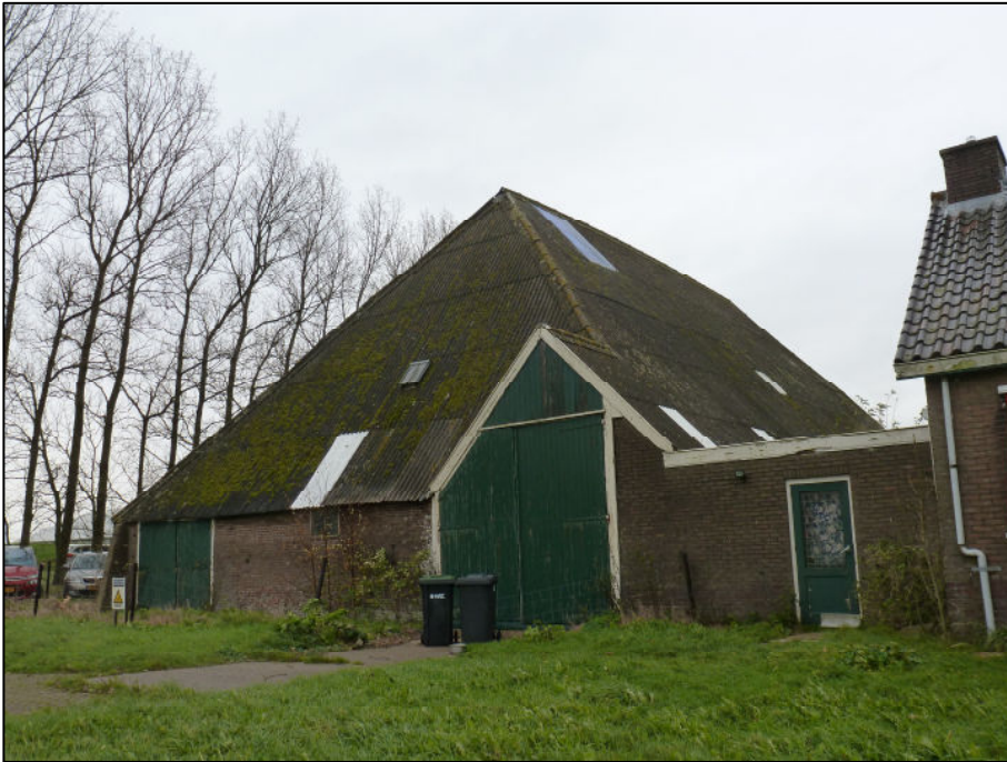
Wierschuur aanzicht november 2014