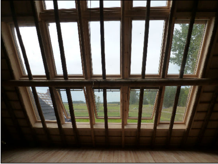
Uitzicht voorkant op de Wierdijk