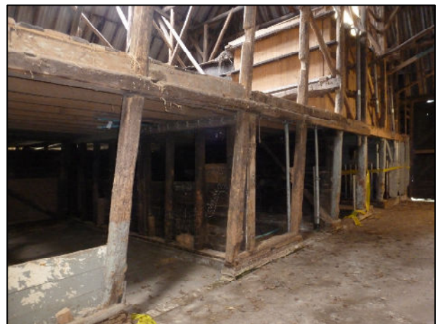
Wiervakken in de schuur (thans verwijderd)