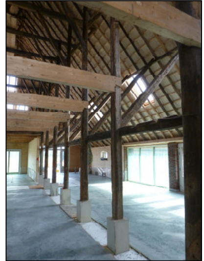
Interieur richting achtergevel