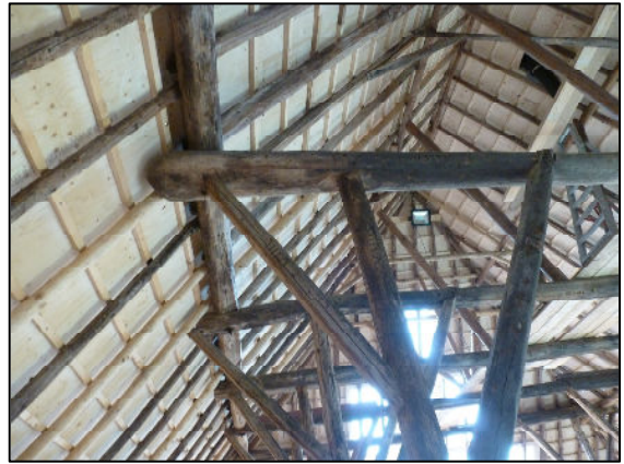
Detail sporenkap, telmerken op de balken