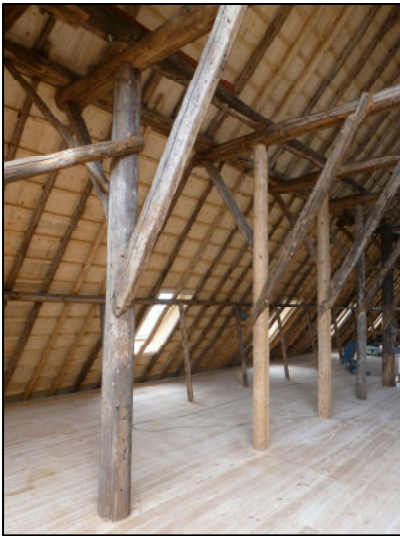
Kap richting linkergevel (NW)