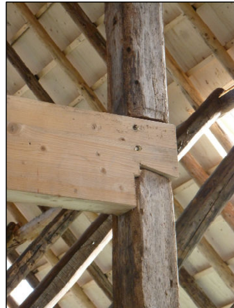
Bevestiging nieuwe balk aan oude staander