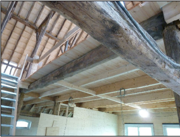
Detail, enige originele dwarsbalk