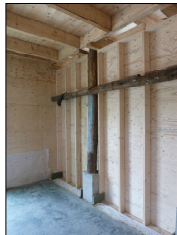
Detail binnenwand met standers in het zicht