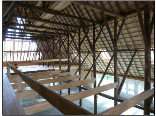
Detail, nieuwe dwarsbalken