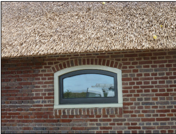
Detail stalvenster linkergevel