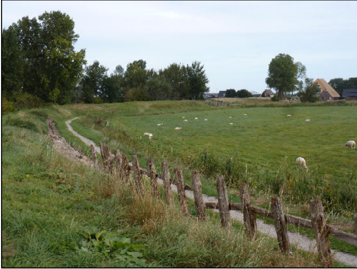
Wierdijk met wierschuur