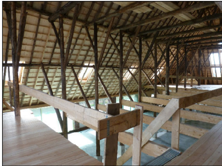
Kap richting rechterdakvlak (ZO)