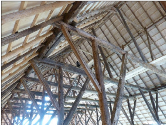
Detail standvinken met telmerken