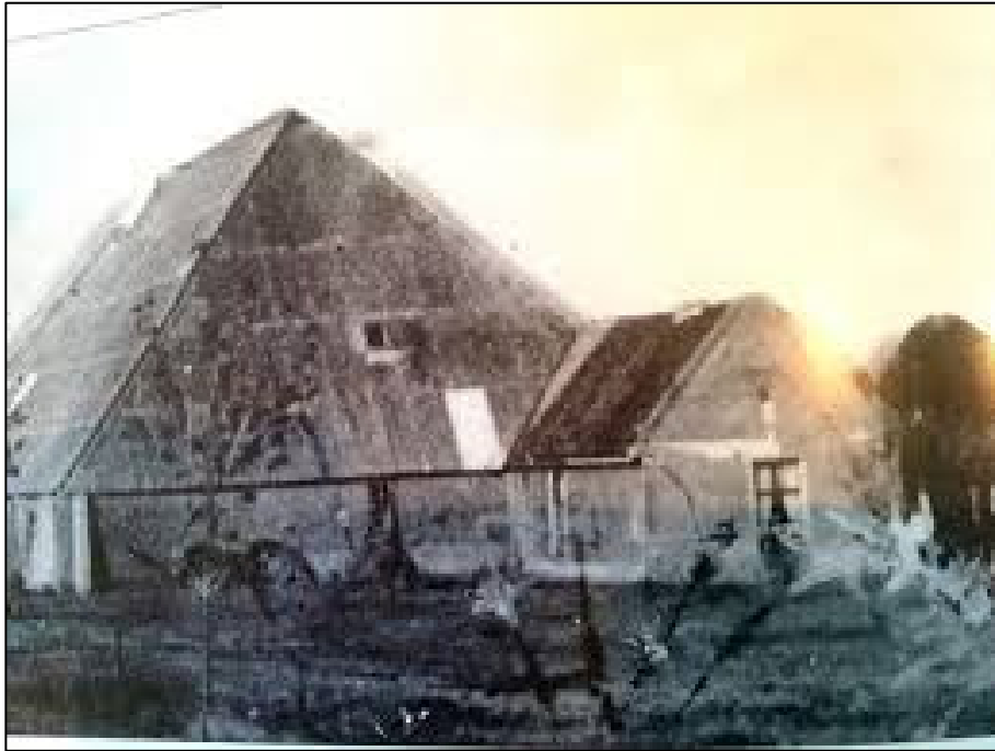
Wierschuur begin 20 e eeuw