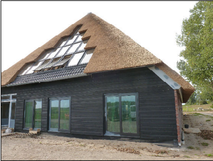
Detail achtergevel rabatdelen