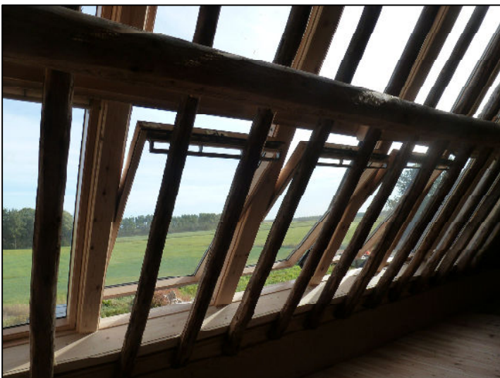
Uitzicht door achterdakvlak