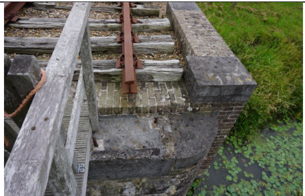
Zuidoostelijke landhoofd (rechter deel)