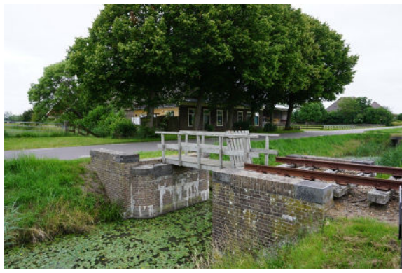
Twee landhoofden aan sloot