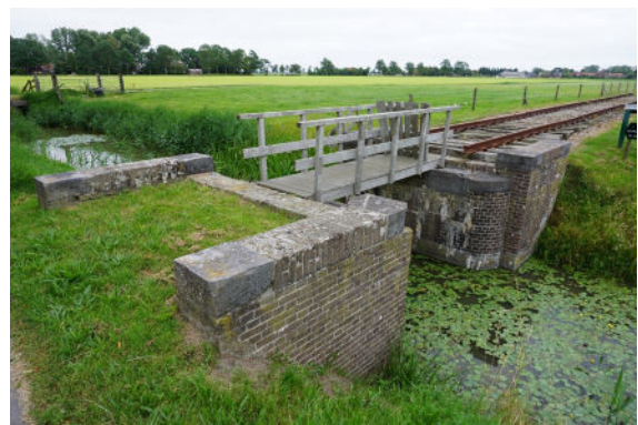
Zicht op zuidwestzijde