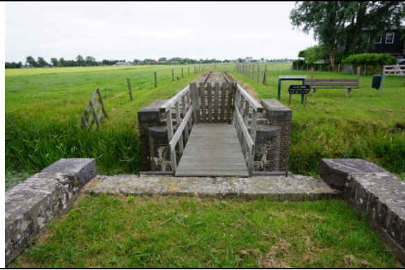
Zicht over aslijn voormalig trace, naar het zuidoosten