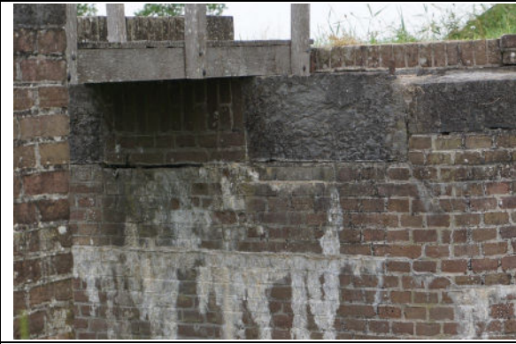
Metselwerk en ingemetselde blokken