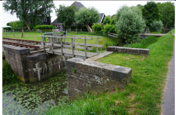
Zicht op noordoostzijde