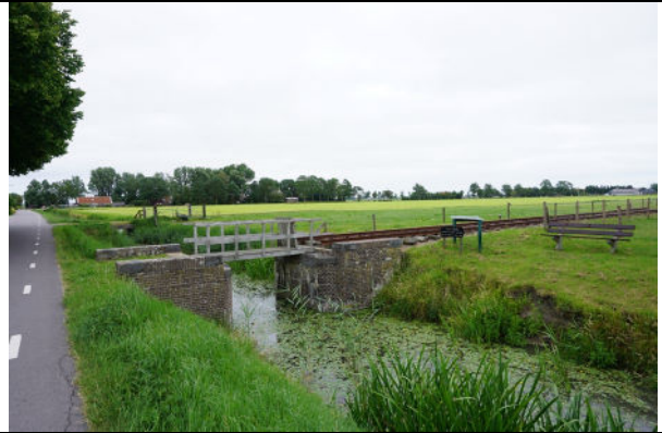
Landhoofden, rechts van de Weereweg