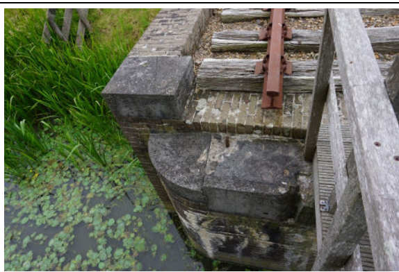
Zuidoostelijke landhoofd (linker deel)