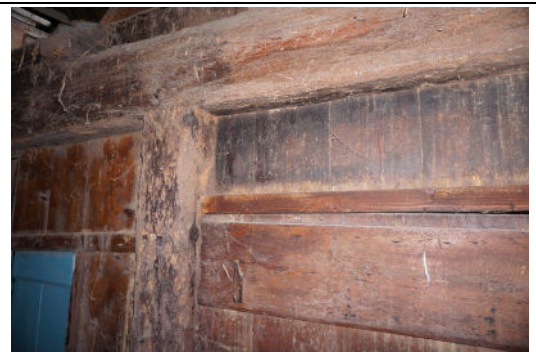
Detail koestalwand, aanzicht vanaf zijde van vierkant