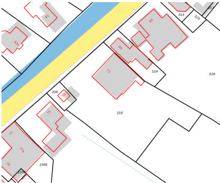
Kadastrale kaart situatie (juli 2019)