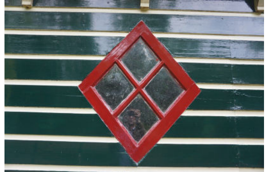
Een van de stalvensters in rechter zijgevel (ZW)