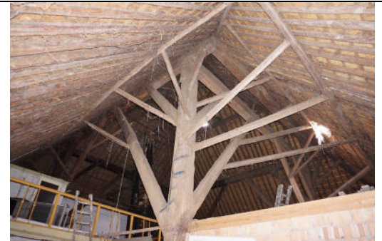
Een van de gebintstijlen