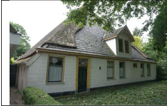
Voorgevel aan de Dorpsstraat