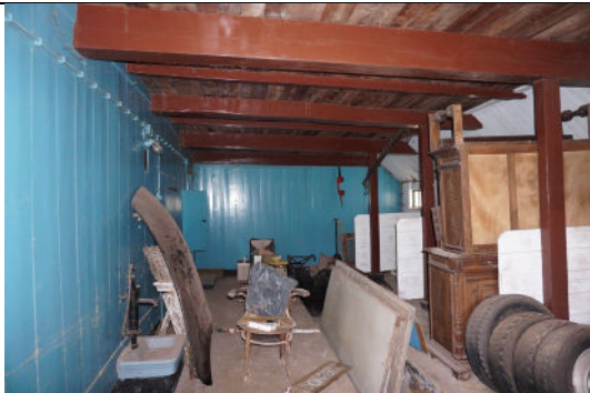
Zicht op gedeelte van de koestal met onder meer houten wand en waterpomp