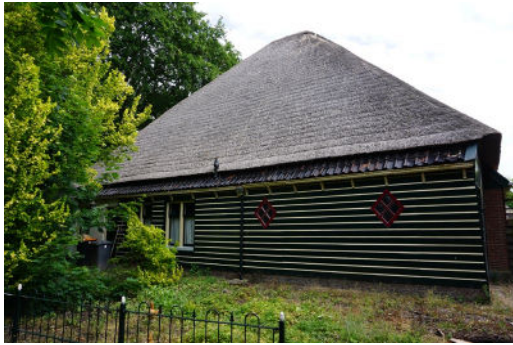
Achterste deel van rechter zijgevel, de weeg (ZW)