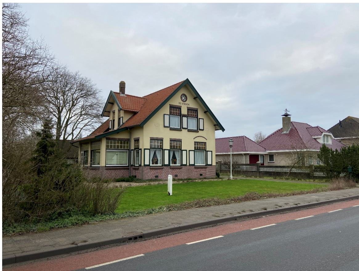
Noord Zijperweg 33 in zijn omgeving

De voormalige burgemeesterswoning ligt in het midden van een rechthoekige kavel. Het grootste gedeelte van de kavel is ingericht als tuin. Aan de voorzijde (zuid) grenst de kavel aan het trottoir. Aan de linkerzijde (west) ligt een sloot. Aan de rechterzijde (oost) ligt de verharde oprit. Aan de achterzijde (noord) loopt een steeg.