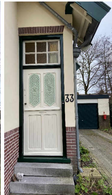
Rechterzijgevel met een detailfoto van de toegangsdeur.