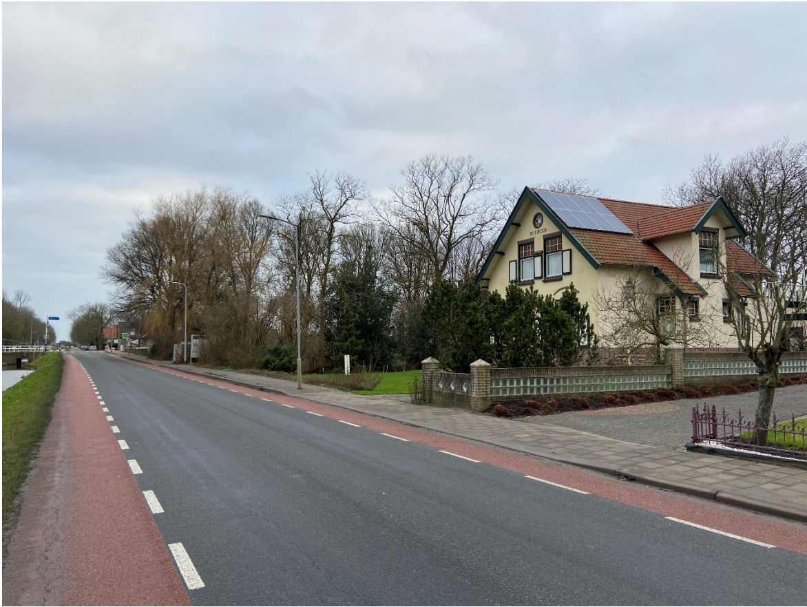
Noord Zijperweg 33 in zijn omgeving