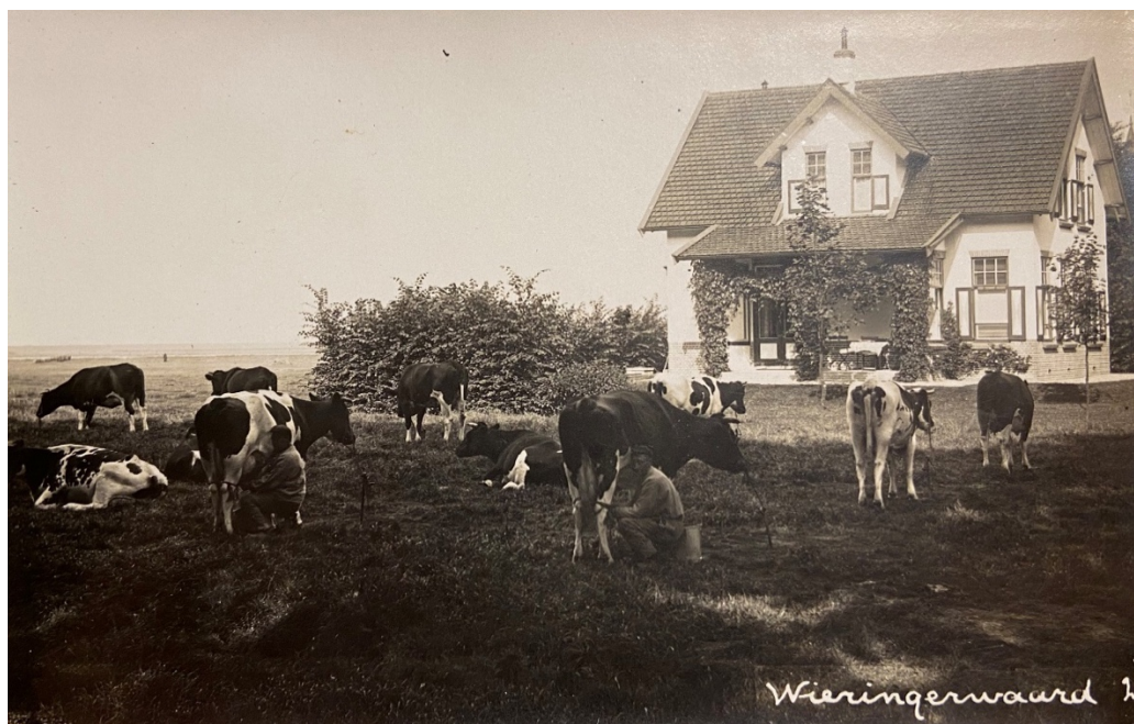
Historische foto Noord Zijperweg 33 in Wieringerwaard, toen nog met een veranda. Datum circa 1920.

Het dorp Wieringerwaard heeft tot ver in de jaren '50 van de vorige eeuw Tweewegen geheten, omdat de bewoningsas bestaat uit twee wegen, de Noord en Zuid Zijperweg die van elkaar gescheiden worden door een sloot. Wieringerwaard is tot 1970 een zelfstandige gemeente geweest en ging toen op in de gemeente Barsingerhorn. In 1990 ging Wieringerwaard op in de gemeente Anna Paulowna die op haar beurt in 2012 op ging in de gemeente Hollands Kroon.