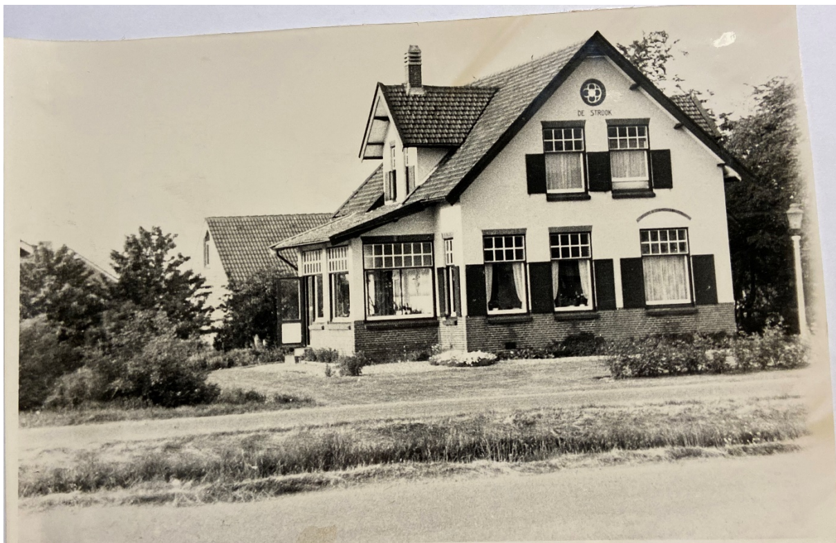
Historische foto van de Noord Zijperweg 33 in Wieringerwaard. Datum circa 1970.