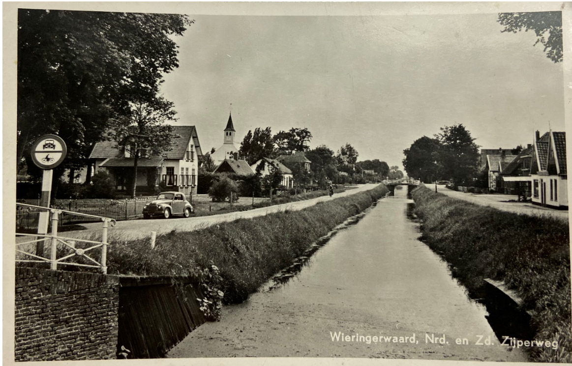
Historische foto de Noord Zijperweg in Wieringerwaard, links op de foto is de voormalige burgemeesterswoning te zien. Datum circa 1950.