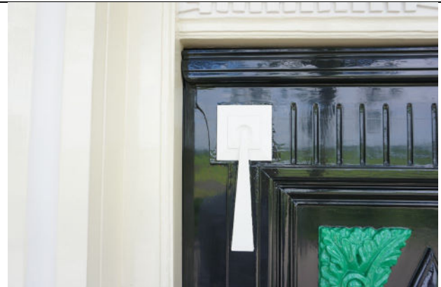
Detail van statiedeur