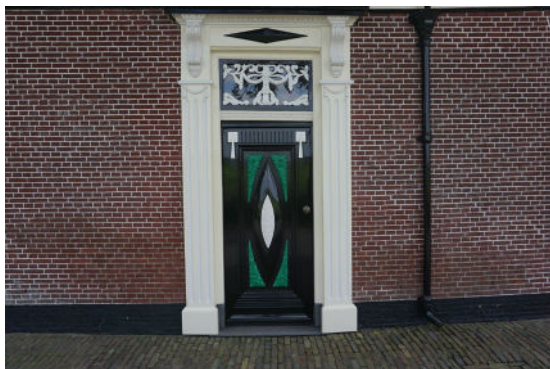
Statiedeur in voorgevel