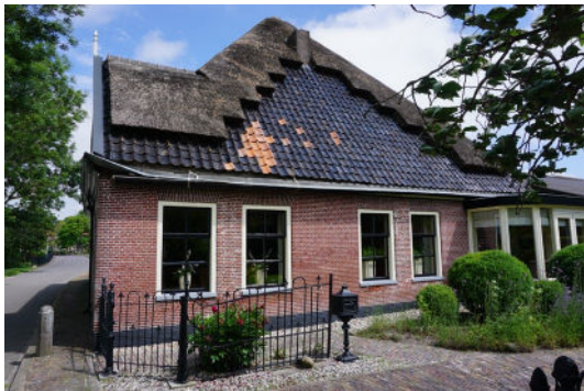
Rechter zijgevel met hekwerk (west)