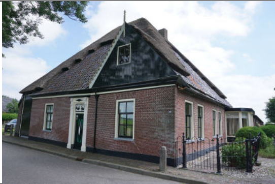
Voorgevel (noord) aan Dorpsstraat