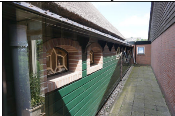
De gemoderniseerde achtergevel (zuid)