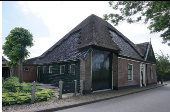
Voorgevel en oostgevel van stulp