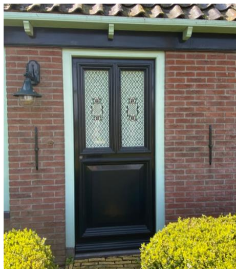
De voorgevel en enkele detailfoto's van de voorgevel.