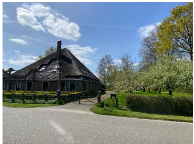
Impressie van de stolp in zijn omgeving