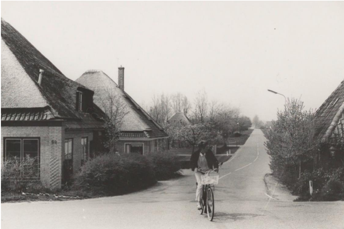
Historische foto Kruising Langereis-Oudeweg, de tweede boerderij links is de boerderij aan de Oudeweg 1. In de linkerzijde is een groot keukenraam te zien. Later zal op deze locatie een uitbouw gerealiseerd worden. Datum 1984.

Het dorp Nieuwe Niedorp kreeg in 1415 tezamen met het dorp Oude Niedorp stadsrechten en de stad kreeg de naam Stede Niedorp. Nieuwe Niedorp was tot 1970 een zelfstandige gemeente en fuseerde daarna met de gemeenten Oude Niedorp en Winkel tot de gemeente Niedorp. De gemeente Niedorp is op haar beurt in 2012 gefuseerd met de gemeenten Anna Paulowna, Wieringen en Wieringenmeer tot de gemeente Hollands Kroon.