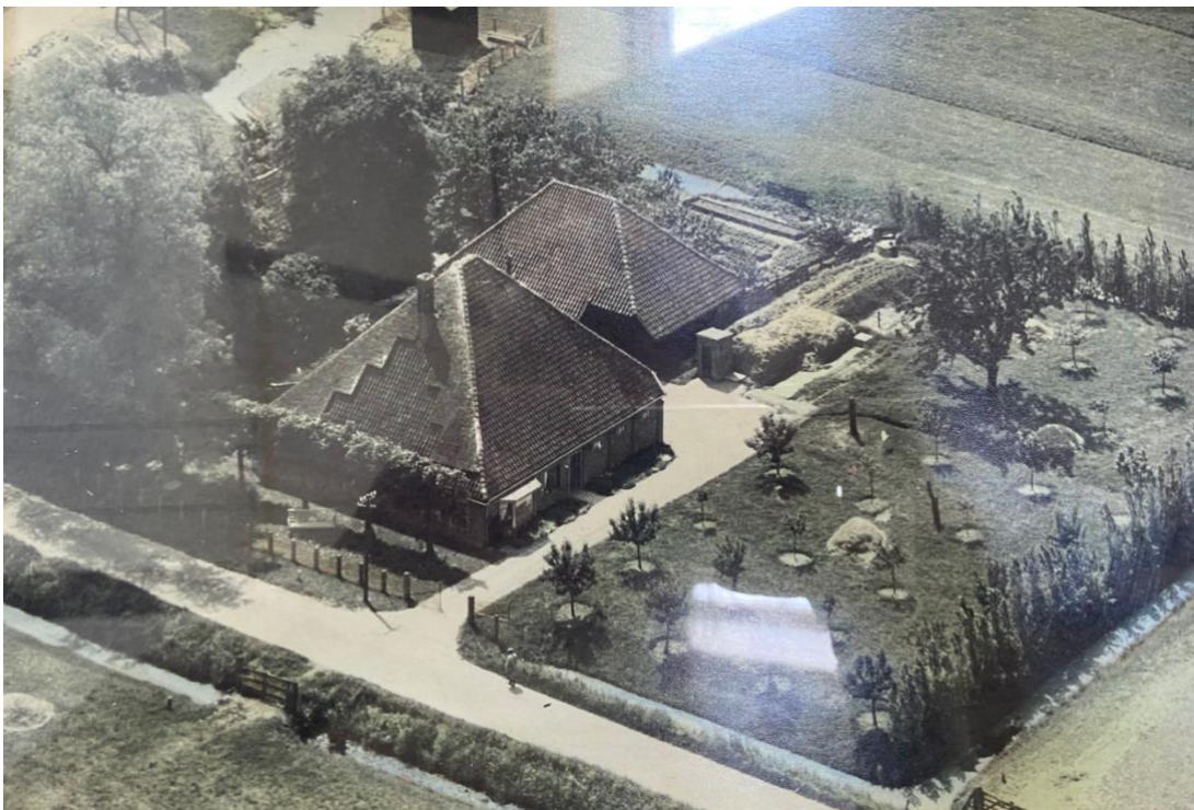
Historische luchtfoto, datum 1951.

De stolpboerderij is gelegen aan de Oudeweg (vroeger Ter Dijcker Wegh) nabij de kruising met de Langereis in Nieuwe Niedorp in het westen van West-Friesland en in het zuiden van de gemeente Hollands Kroon. West-Friesland is een oud zeekleilandschap dat vanaf de IJzertijd vernatte waardoor veenontwikkeling tot stand kwam. Het gebied werd vanaf de vroege Middeleeuwen in ontginning genomen en de Langereis heeft daarbij een belangrijke rol gespeeld. Deze waterloop functioneert al sinds de 14e eeuw als afwatering van het gebied tussen Veenhuizen en Winkel/Aartswoud en vormt de grens van twee grote verkavelingsblokken: de Niedorper Kogge en het Hoogwouder Ambacht. De ontwatering van het veen leidde echter tot inklinking en vertering van het veen, waardoor de bodem sterk daalde. De nederzettingen in het veenweidegebied werden gebouwd op de hoogste plaatsen in het landschap zoals strandwallen, kreekruggen en ontginningsdijken en kregen de vorm van langgerekte linten. Nieuwe Niedorp is een lintdorp gelegen op een dergelijke kreekrug en is oost-west georiënteerd.