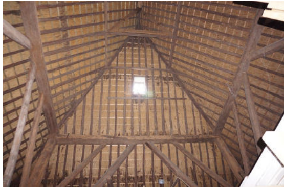
Kap met nok, zicht naar noordschild