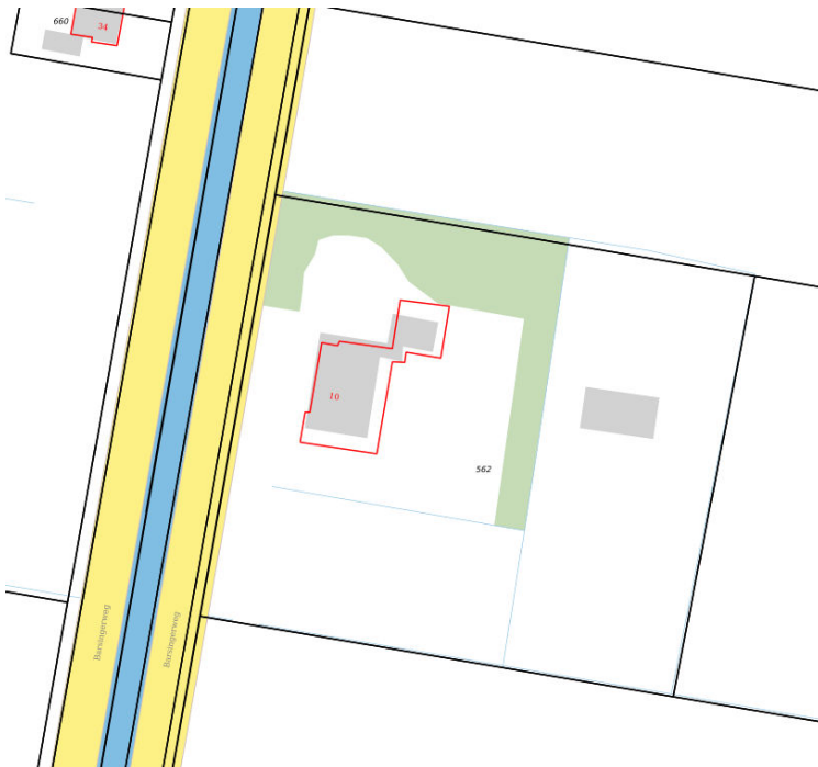
Kadastrale kaart situatie (september 2019)