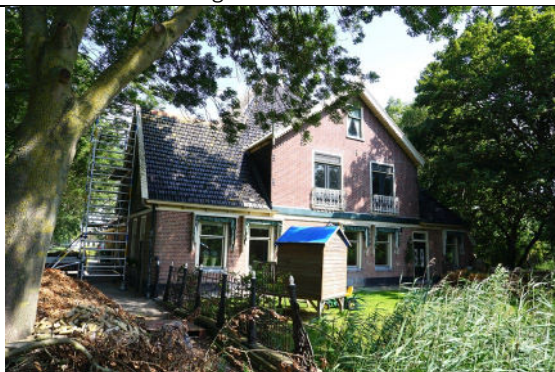
Zuidgevel met hekwerk