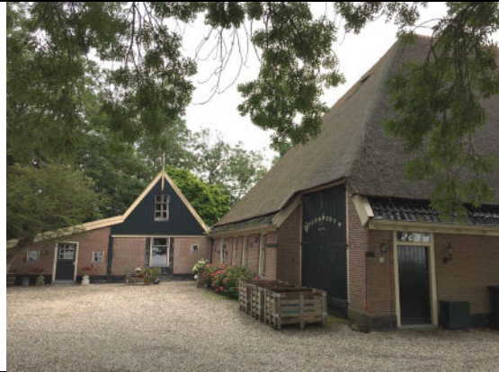
Noordelijk deel van stolp en bijgebouw