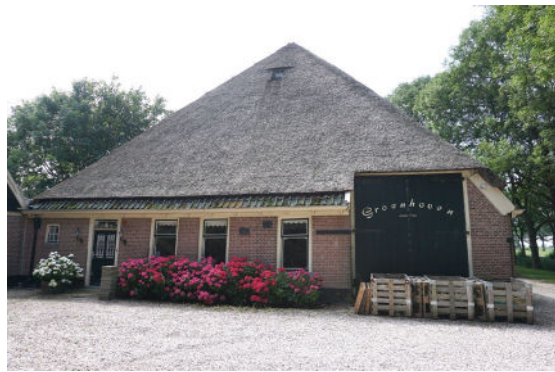
Noordgevel met darsdeur