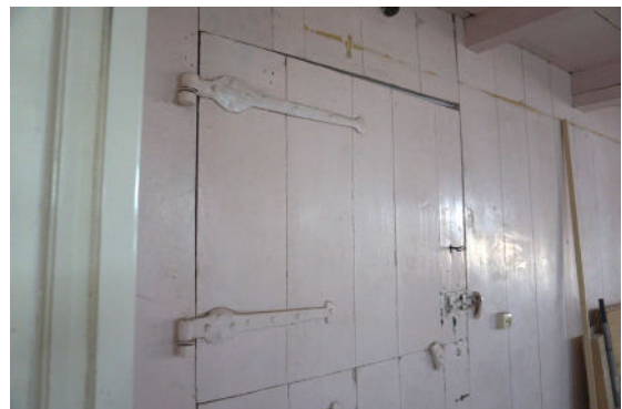
Deel van deur in houten wand bij koestal