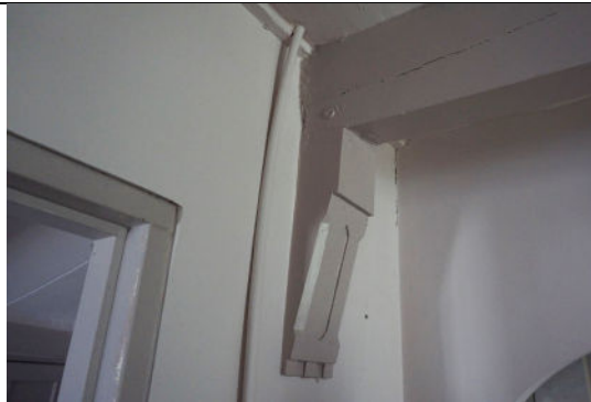
Houtsnijwerk detail in interieur