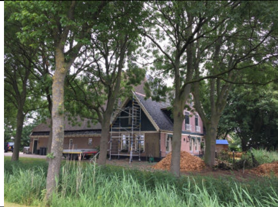
Zicht vanuit het zuidwesten op stolp, erf en geboomte