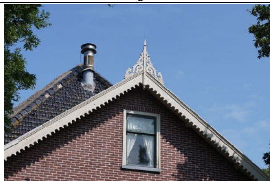
Houten versierde makelaar zuidgevel