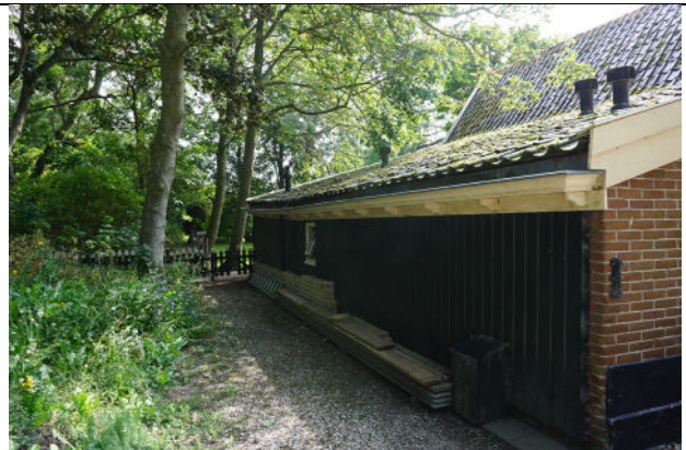
Noordelijke lage aanbouw bijgebouw