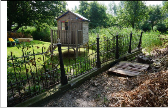
Deel van het hek