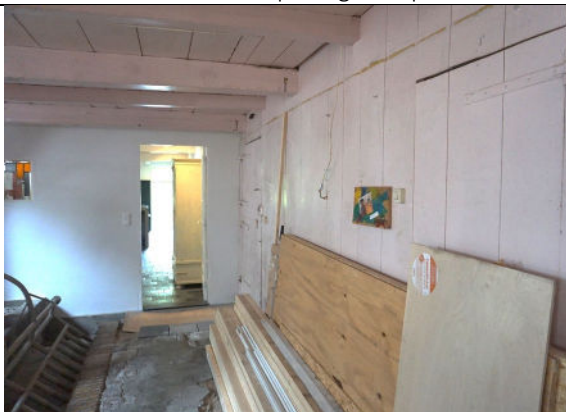
Houten wand (rechts) bij koestal