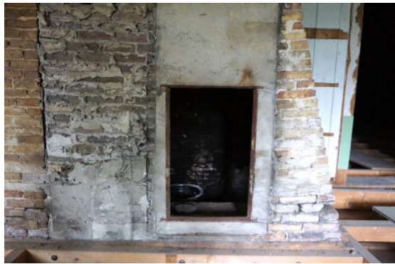
Schoorsteen met opening van spekluk