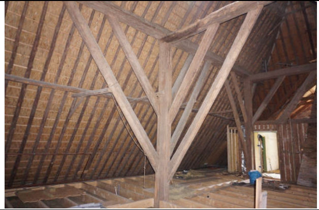
Een van de gebintstijlen op verdieping