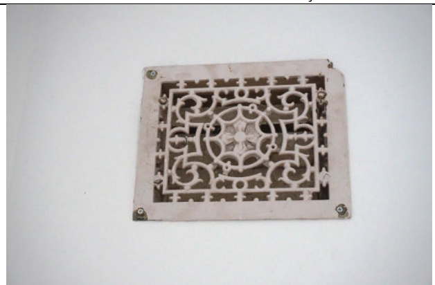
Een van de ventilatie-roosters woongedeelte