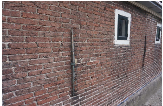
Deel van achtergevel (zuid)