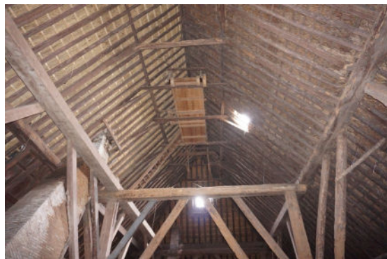
Nok van kap, zicht in lengterichting, naar oosten