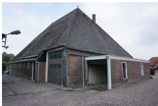
Achtergevel (links) en oostgevel