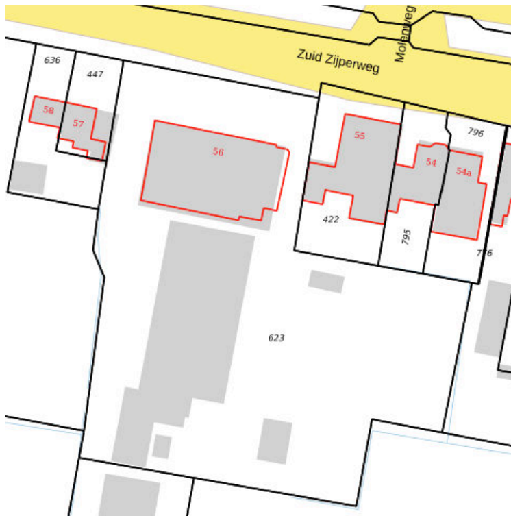
Kadastrale kaart situatie (september 2019)