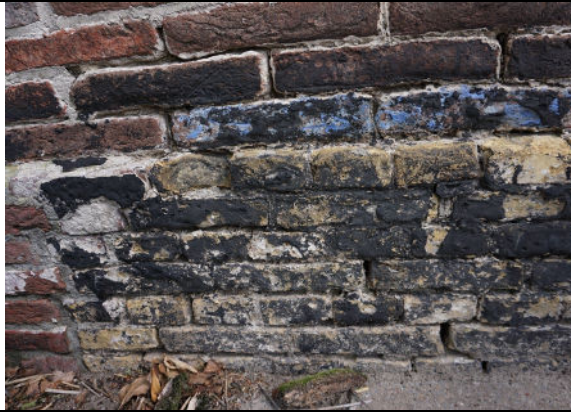
Deel van plint in achtergevel