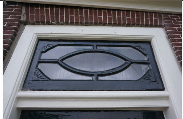
Bovenlicht bij linker deur in voorgevel