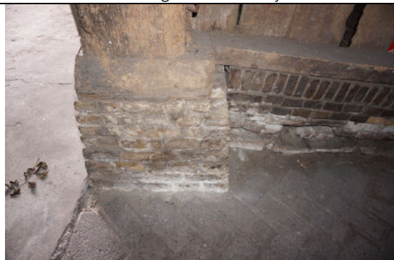
Poer van zuidoostelijke gebintstijl bij houten wand