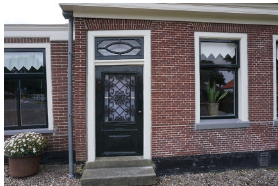
Linker deur in voorgevel