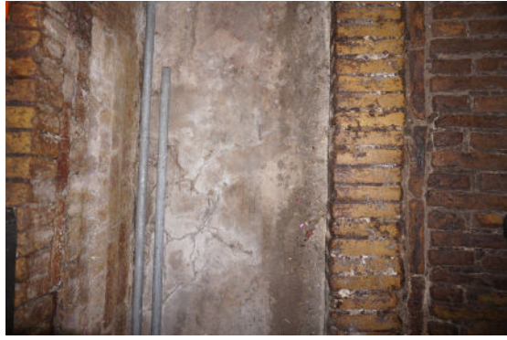
Grup in koestal