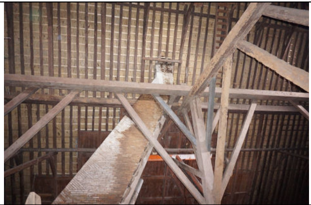
Deel van gebint met schoorsteen, zicht naar noordschild