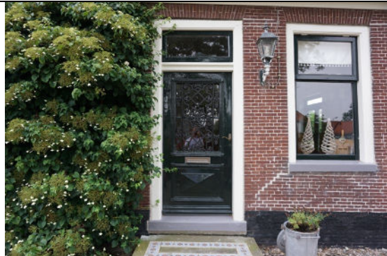
Rechter deur in voorgevel