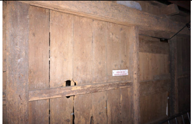
Deel van houten wand zuidelijke buitenstijlregel