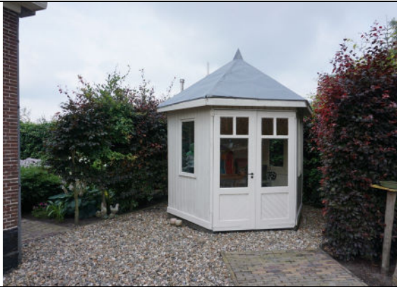
Houten theehuisje op erf