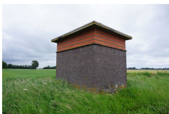
Achtergevel en linker zijgevel