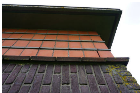
Deel van fries langs rand