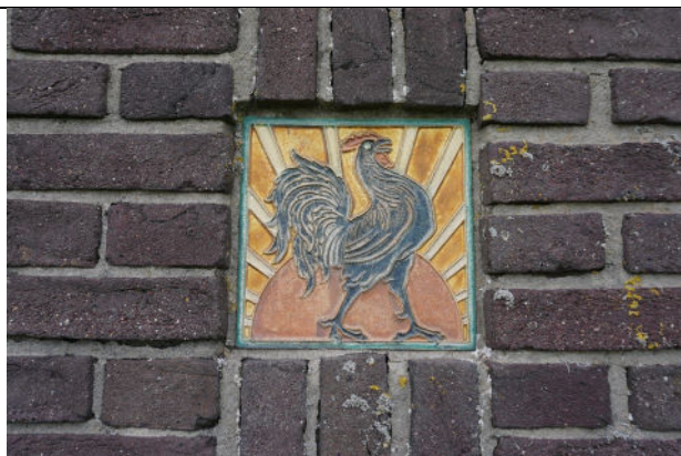
Tegel met voorstelling van haan