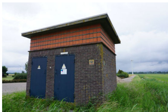
Zicht vanaf doorgaande weg op voorgevel