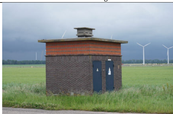
Situatie in open landschap