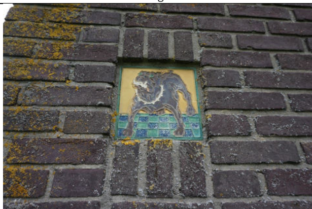
Tegel met voorstelling van hond in rechter zijgevel