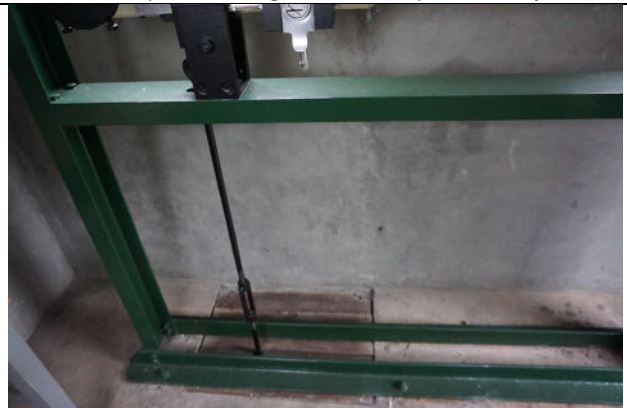
Verbindingsmechaniek in huisje