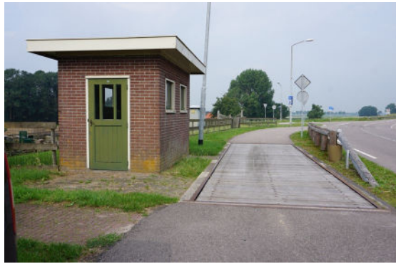
Weeghuisje met weegbrug