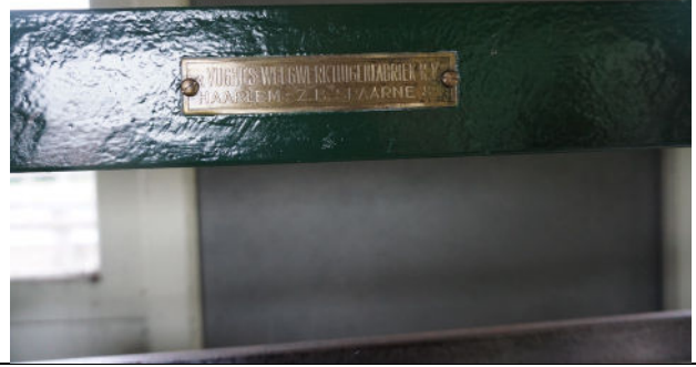
Naamplaatje producent Van Vught