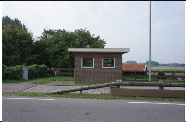
Zicht op weeghuisje vanaf dijk