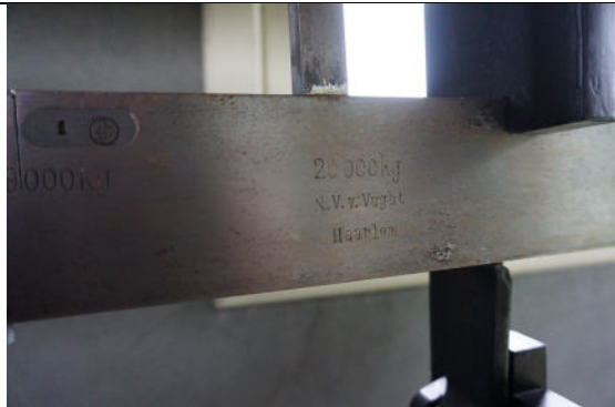
Aanduiding gewicht 20.000 kg