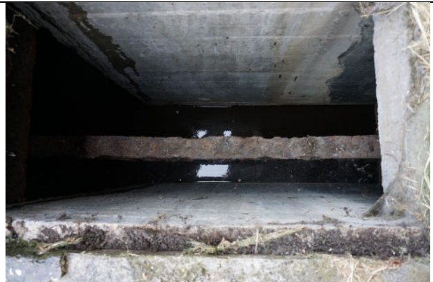
Zicht op verbindingarm tussen put en huisje