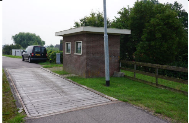
Zicht vanuit noordwesten