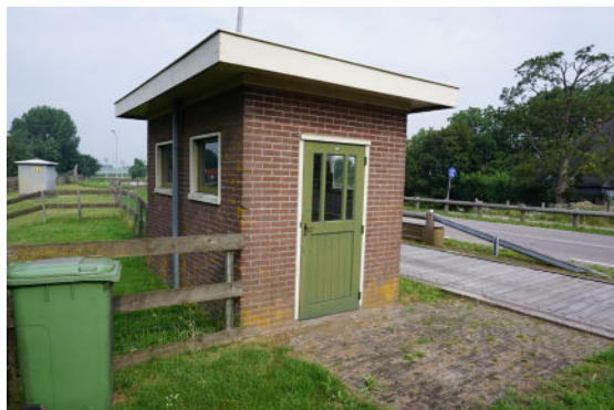
Zuidoostgevel (rechts) en zuidwestgevel (links)