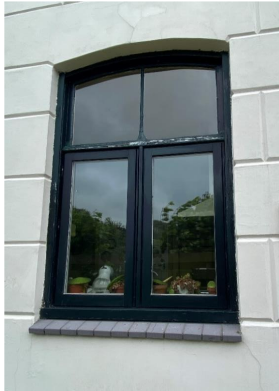
Achtergevel en een detailfoto van het kozijn in de achtergevel.