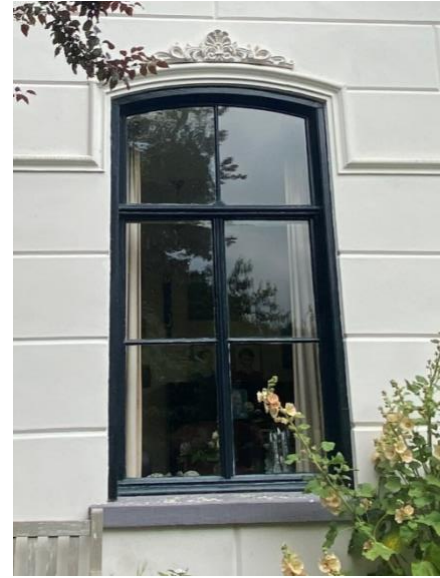
Linkerzijgevel en detailfoto kozijn linker zijgevel.