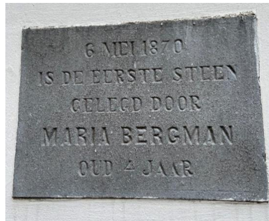
Rechterzijgevel en een detailfoto van de eerste steenlegging.