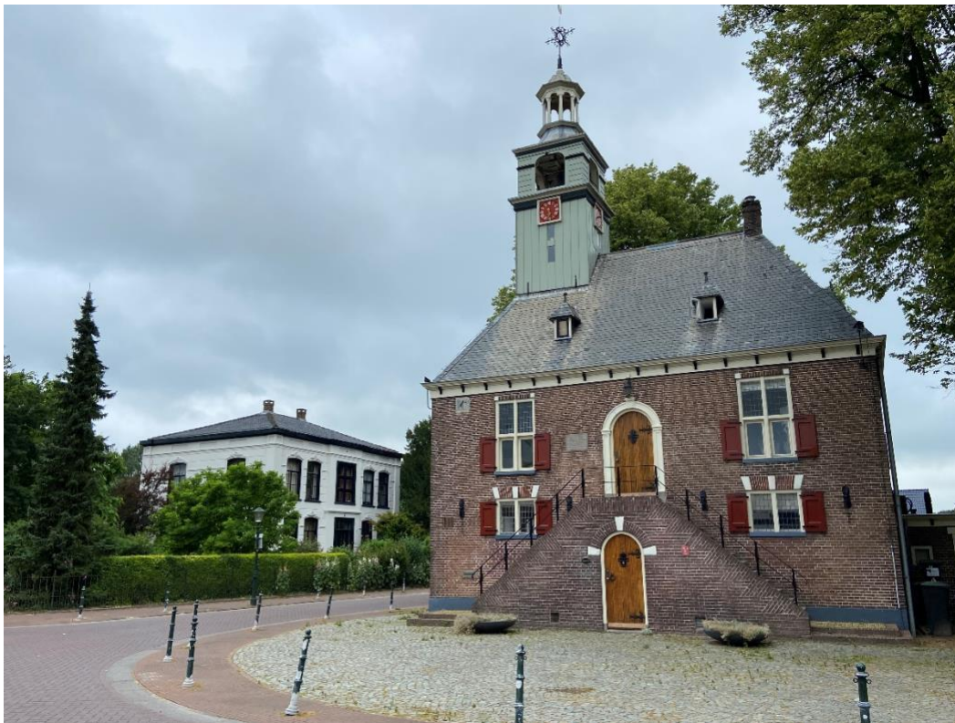
Bosstraat 1 prominent gelegen op een kruising van wegen in de nabijheid van het voormalige Regthuis.

De onderwijzerswoning staat op de noordzijde van de kavel. Aan de voor (oost) en linkerzijde (zuid) wordt het pand omsloten door de tuin die karakteristiek vertoont van een Engelse landschapstuin met doorkijkjes, paden en boomgroepen. Aan de achterzijde (west) loopt een smal grindpad en staat een houten erfafscheiding. Aan de rechterzijde (noord) ligt de verharde oprit. Het geheel wordt omsloten door het oorspronkelijke ijzeren sierhekwerk.