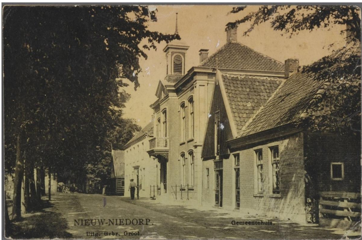
Op de foto zijn de herberg 'Prins Maurits' te zien, het raadhuis en de timmerwerkplaats met naastgelegen woonhuis. Historische foto, datum onbekend.

Nieuwe Niedorp is gelegen in het westen van West-Friesland, in het zuiden van gemeente Hollands Kroon. West-Friesland is een oud zeeleilandschap dat vanaf de IJzertijd vernatte waardoor veenontwikkeling tot stand kwam. Het gebied werd vanaf de vroege Middeleeuwen in ontginnen genomen. Vanuit bestaande veenrivieren werden in het veen parallelle sloten gegraven voor de ontwatering van het veen. De nederzettingen in het veenweidegebied werden geplaatst op de hoogste plaatsen in het landschap zoals strandwallen en kreekruggen en kregen de vorm van langgerekte linten. Nieuwe Niedorp is een lintdorp gelegen op een kreekrug en is oost-west georiënteerd. Het lintdorp Nieuwe Niedorp is in de 13e eeuw ontstaan. Het oude lint wordt gevormd door het gebied Dorpsstraat/Schulpweg. Aan weerszijden van dit lint bevindt zich voornamelijk vrijstaande bebouwing van één, soms twee bouwlagen met een kap. Aan de zuidzijde van de Dorpsstraat staan de gebouwen vlak aan de weg, aan de noordzijde worden de gebouwen van de weg gescheiden door een brede berm met boombeplanting en een voorsloot. Het dorp kreeg in 1415 tezamen met het dorp Oude Niedorp stadsrechten en de stad kreeg de naam Stede Niedorp. Nieuwe Niedorp was tot 1970 een zelfstandige gemeente daarna volgde een fusie met de toenmalige gemeenten Oude Niedorp en Winkel tot de gemeente Niedorp die in 2012 weer opging in de gemeente Hollands Kroon.