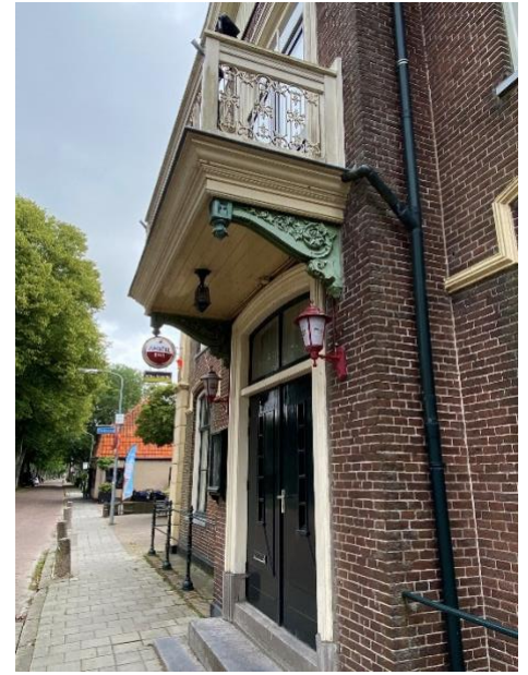
Voorgevel en detailfoto van het balkon