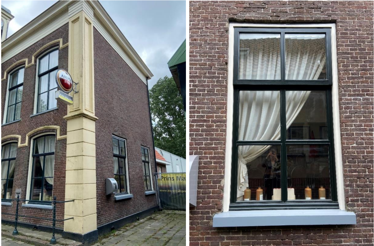
Rechterzijgevel met een detailfoto van het raamkozijn

De rechterzijgevel bevat twee zesruits schuifvensters. Verder is aan de rechterzijgevel de plat afgedekte uitbreiding van 1975 zichtbaar. Tevens is een gedeelte van de gereconstrueerde aanbouw zichtbaar die oorspronkelijk bij het pand aanwezig was.