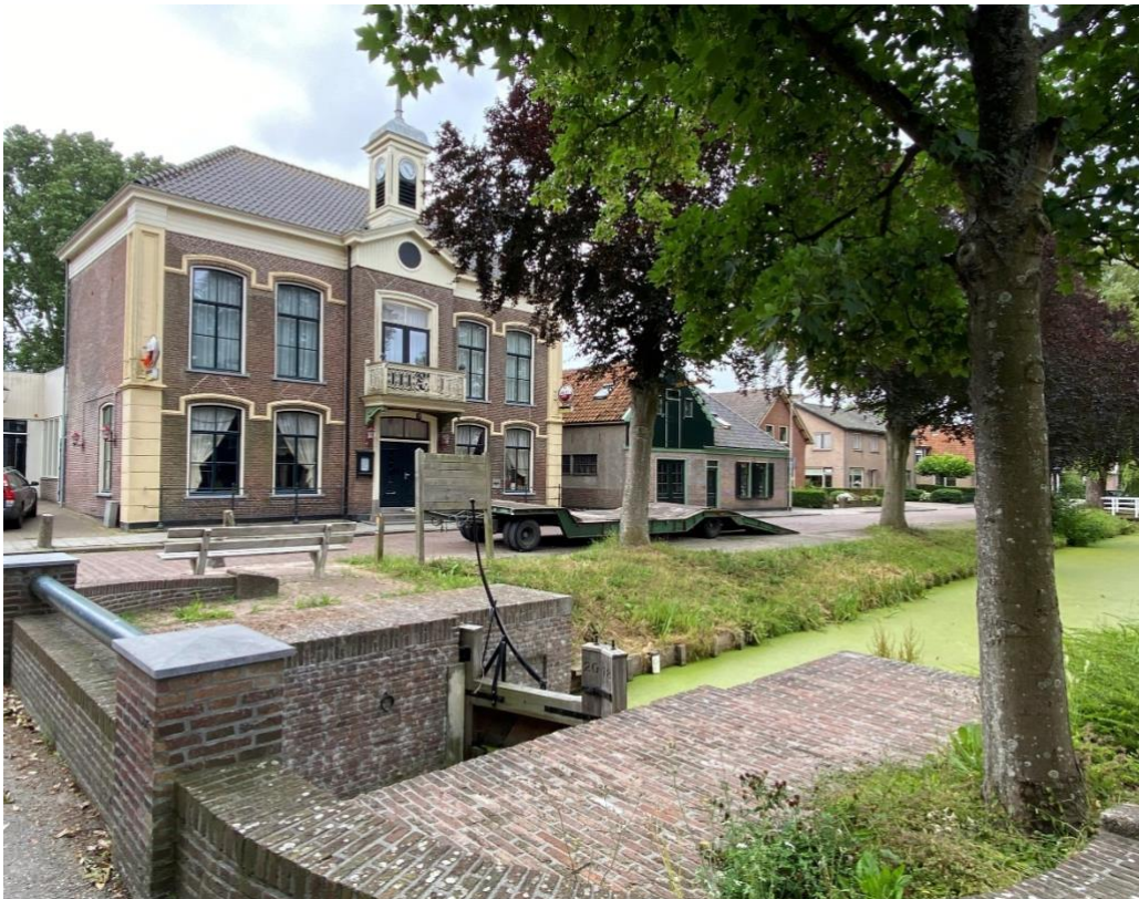
Het pand in zijn omgeving gelegen tussen de lintbebouwing met aan de voorzijde de voorsloot met schutsluis.

Het pand bevindt zich aan de noordzijde van een langgerekte kavel en ligt met de voorgevel (west) aan het trottoir. Het pand heeft aan de voorzijde een hardstenen stoep met smeedijzeren hekwerk. Links (noord) van het pand ligt een verhard pleintje op de locatie waar ooit het café 'Prins Maurits' stond. Rechts (zuid) van het pand ligt de verharde oprit die toegang biedt tot het erf en een doorzicht geeft over het achtergelegen open weidelandschap. Aan de achterzijde (oost) van het pand ligt de tuin.