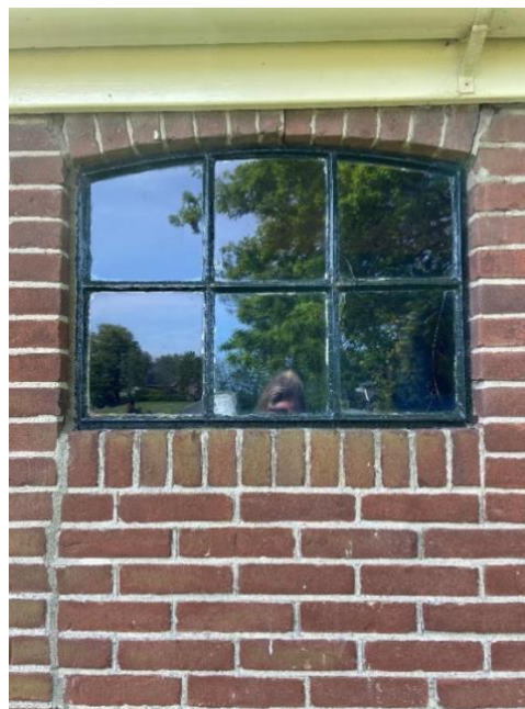
De achtergevel en een detailfoto van de achterdeur en het stalraam.