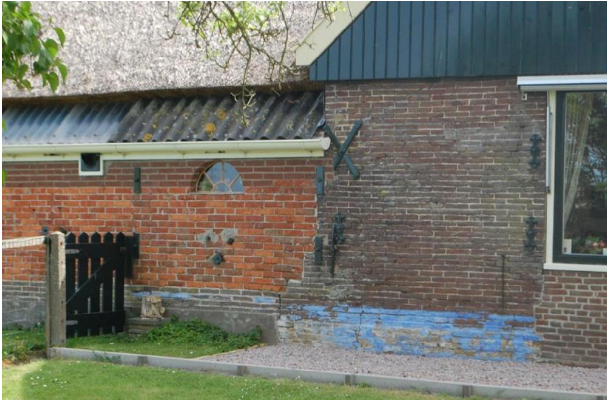
Detailfoto van de linkerzijgevel.