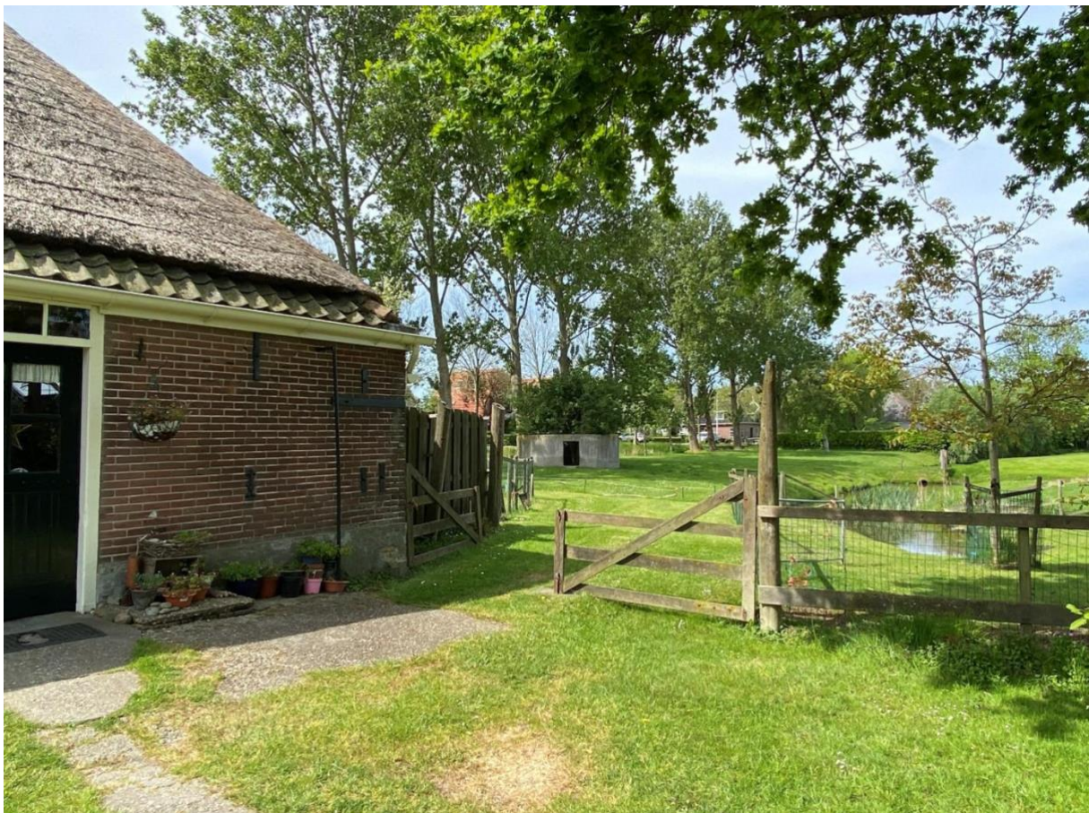
De stolpboerderij in zijn omgeving met vrij zicht naar het achterland.