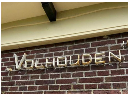
Voorgevel en een detailfoto van de naamaanduiding.