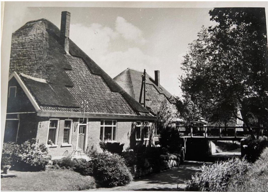
Historische foto Heerenweg 19. Datum 1961.