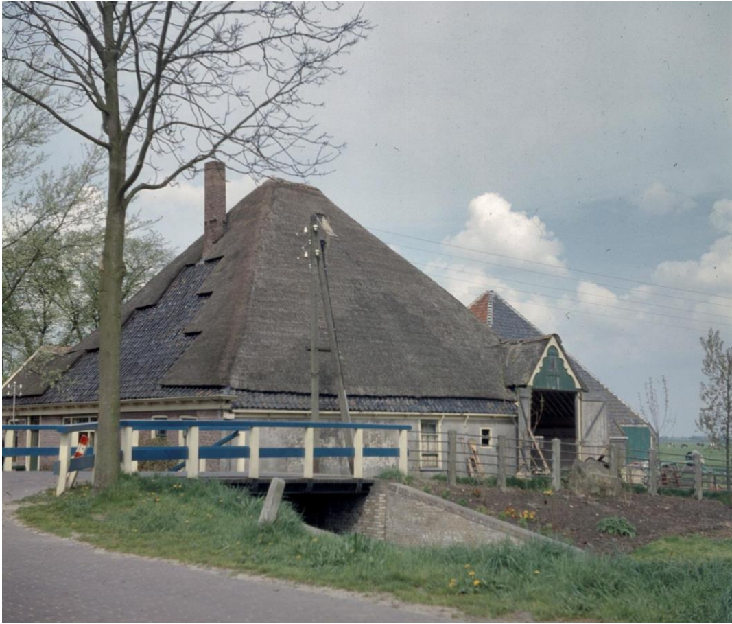
Historische foto Heerenweg 19. Datum 1959. De stolpschuur op het achtererf is nog aanwezig.