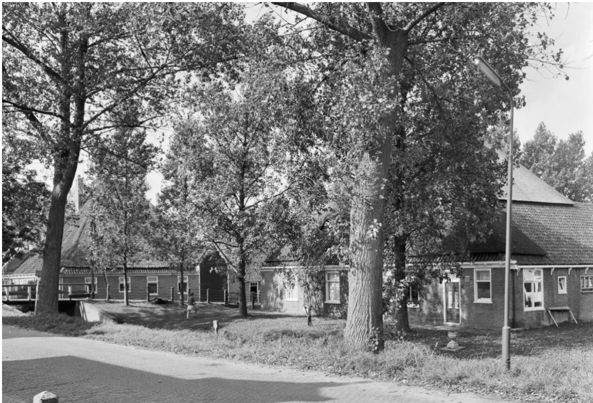
Historische foto Heerenweg 19 en 21. Datum 1968. De rechterzijgevel is inmiddels gewijzigd.