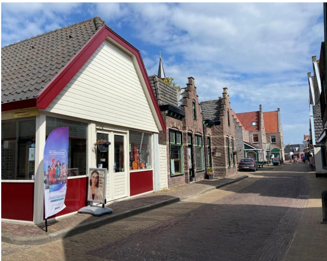
Het pand in zijn omgeving.