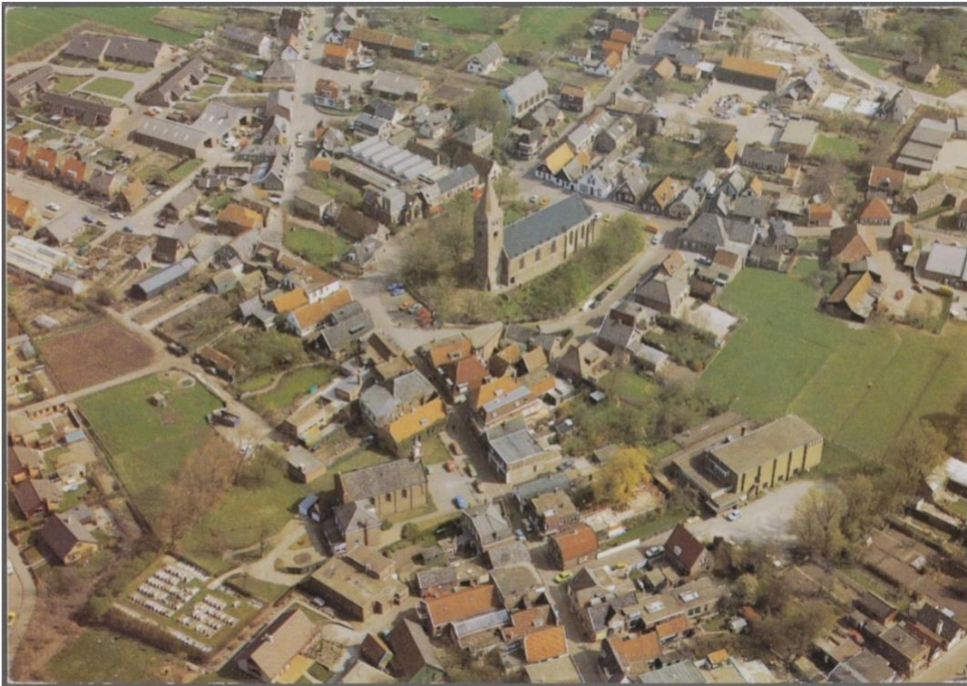
Historische luchtfoto met daarop de Rooms Katholieke kerk met daarnaast het voormalige woon-winkelpand Hoofdstraat 16, midden op het Kerkplein staat de Protestantse kerk.