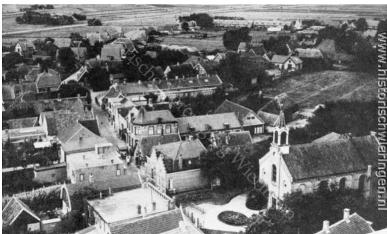
Historische luchtfoto uit 1910.