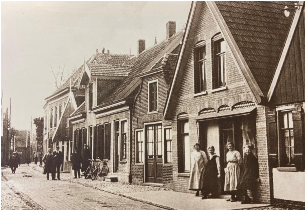
Historische foto van het Kerkplein in Hippolytushoef. Kerkplein 12 is het pand met de vier dames voor de gevel. Datum circa 1920.

De belangrijkste bestaansbronnen tot de twintigste eeuw waren de veeteelt en de visserij. In 1927 kwam de aanleg van de Amsteldiepdijk gereed. De Amsteldiepdijk ligt tussen Van Ewijcksluis en Wieringen en sluit een deel van het Amsteldiep en het Ulkediep af. Met de aanleg van de Amsteldiepdijk kreeg Wieringen een directe verbinding met het vasteland van Noord-Holland en was het niet langer een eiland.