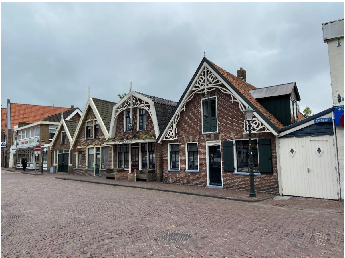
Het pand in een rij met soortgelijke woningen aan het Kerkplein met de Hippolytuskerk op een terp.

Het pand staat aan de noordzijde van een langgerekte kavel en is met de voorzijde (oost) direct aan de stoep gelegen. Links (zuid) van het pand staat een schuur vermoedelijk uit dezelfde bouwperiode. Deze schuur heeft altijd als opslag gediend voor het winkelpand met woonhuis. Rechts (noord) van het pand staat het naastgelegen pand nr. 13. Aan de achterzijde (west) ligt de modern aangelegde tuin met achterom.