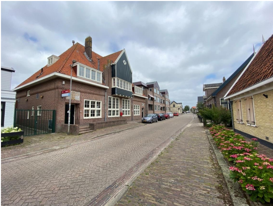
Het pand in zijn omgeving

Het pand staat aan de noordzijde van de kavel en is met de voorzijde (zuid) direct aan de stoep gelegen. Links (west) van het pand ligt een steeg die toegang biedt tot de in de jaren '80 gerealiseerde aanbouw. Rechts (oost) van het pand staat het naastgelegen appartementencomplex 'Koningshof'. Aan de achterzijde (noord) ligt de tuin met grote kastanjeboom en staat een schuurtje uit dezelfde bouwperiode als het voormalige postkantoor.