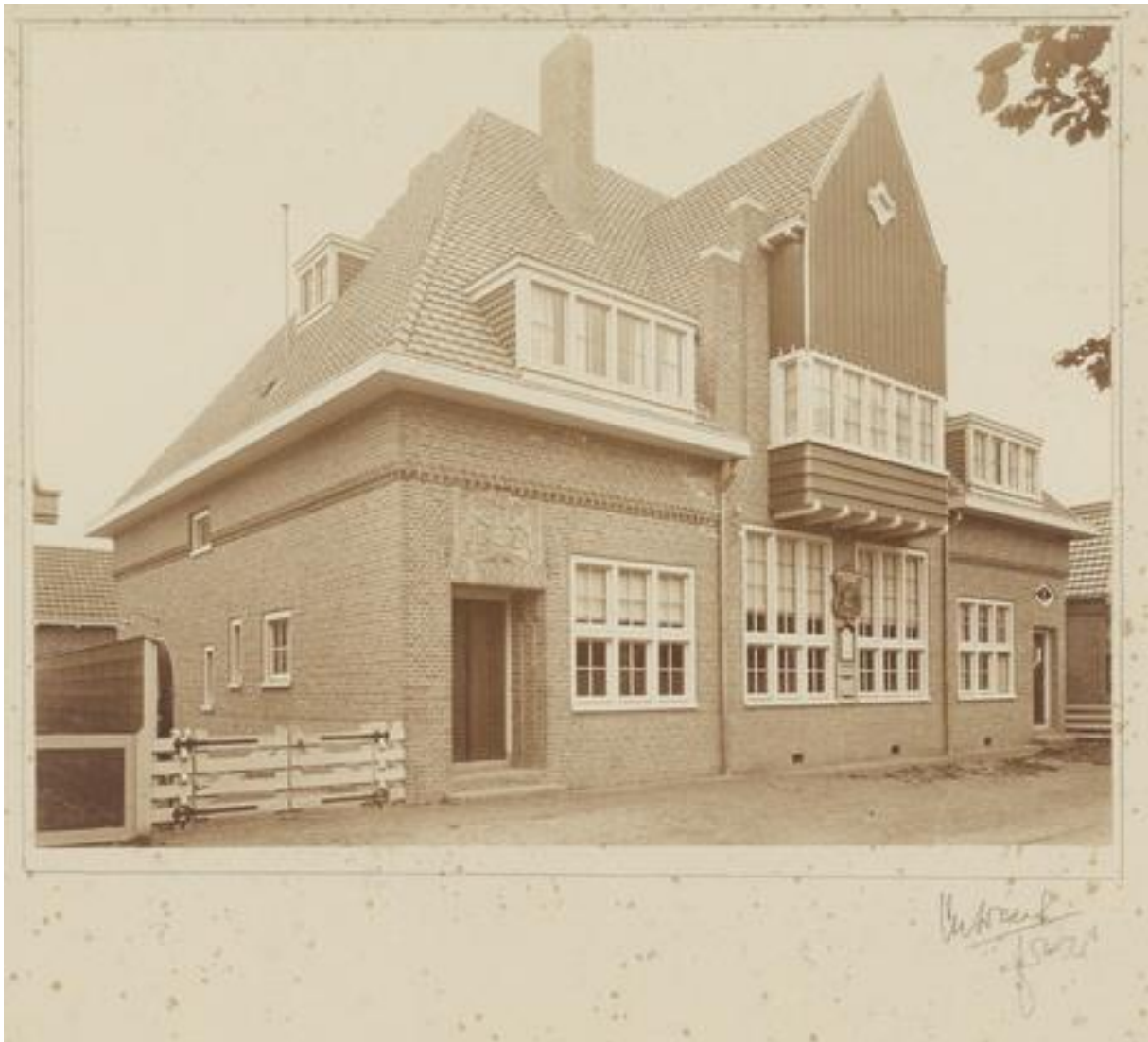
Historische foto van het voormalige postkantoor aan de Koningstraat, datum onbekend.