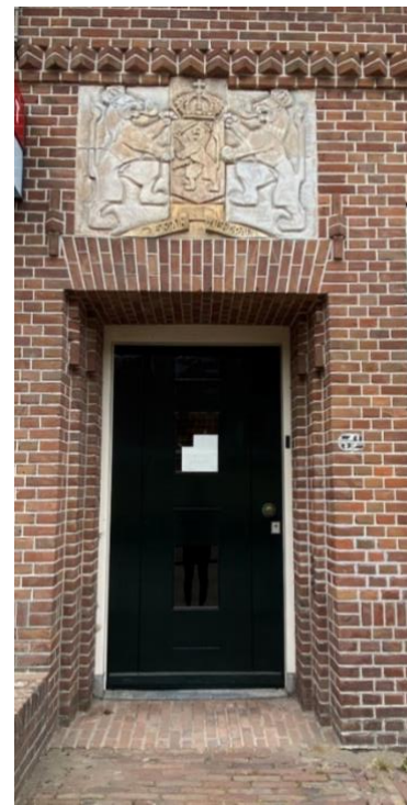
Enkele detailfoto's van de voorgevel