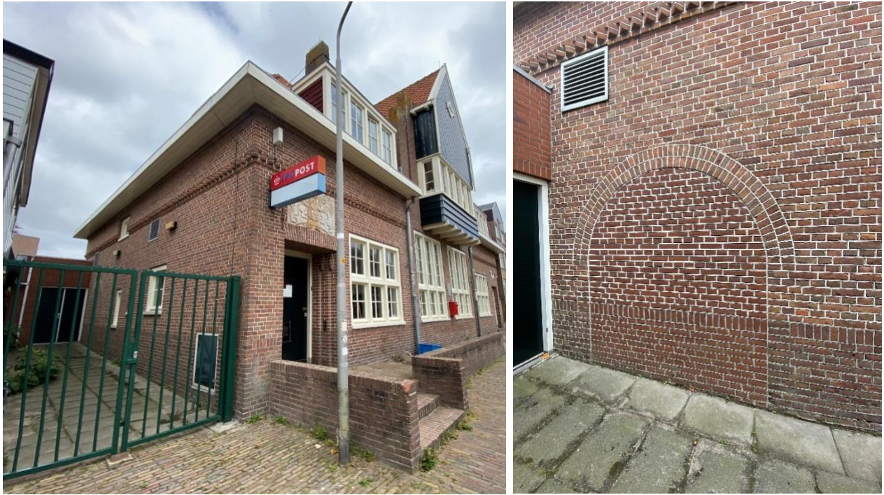
De linkerzijgevel en een detailfoto van voormalige toogdeur die is dichtgemetseld

De linkerzijgevel is asymmetrisch van opzet en kent een onregelmatige vensterindeling. Van links naar rechts: een dicht gemetselde toogdeur, de getoogde dubbele rollaag is als bouwspoor nog zichtbaar in het metselwerk, twee keer een tweeruits venster en daarnaast een zesruits venster en geheel rechts in de gevel een houten luik. Op de verdieping twee stalen schoepenroosters en een tweeruits venster. In het linkerdakvlak zit een houten plat afgedekte dakkapel met twee keer een vierruits venster, de wangen van de dakkapel zijn bekleed met houten delen.