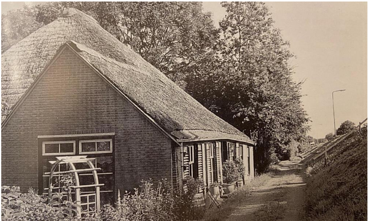
Foto uit 2002. De kopgevel is wederom gewijzigd, met een andere gevelindeling. De kenmerkende waterborden, windveren en makelaar zijn verdwenen. Aan de oostgevel zijn houten persiennes bevestigd.