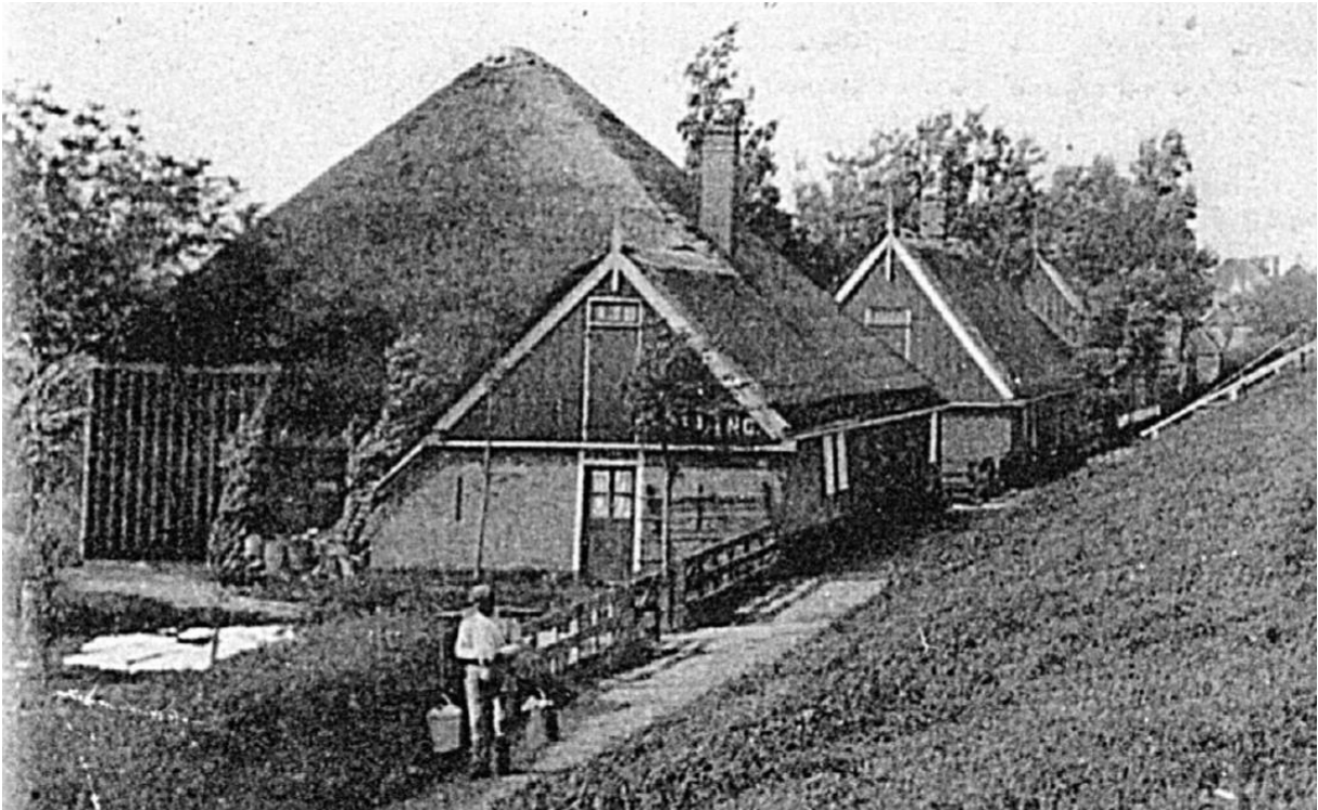
Historische foto uit 1905, met in het midden de houten topgevel van het staartstuk met de oorspronkelijke gevelindeling en aan de rechterzijde de oorspronkelijke aanlufing.