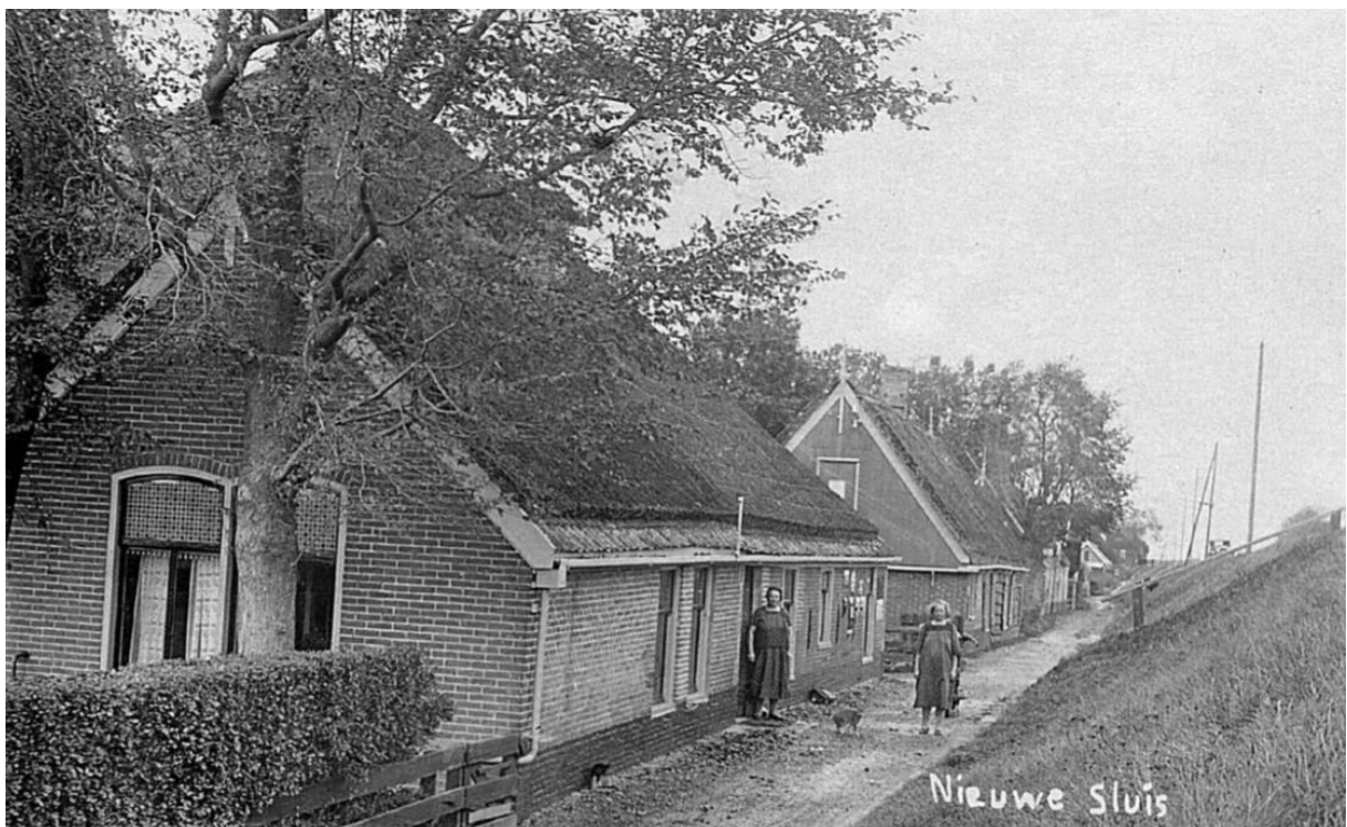
Historische foto uit 1930. De houten topgevel aan de zuidzijde (links) is vervangen door metselwerk en er is een gekoppeld kozijn aangebracht.