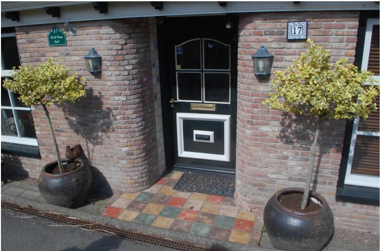
Voorgevel en een detailfoto van de voordeur in de portiek met afgeronde hoeken.