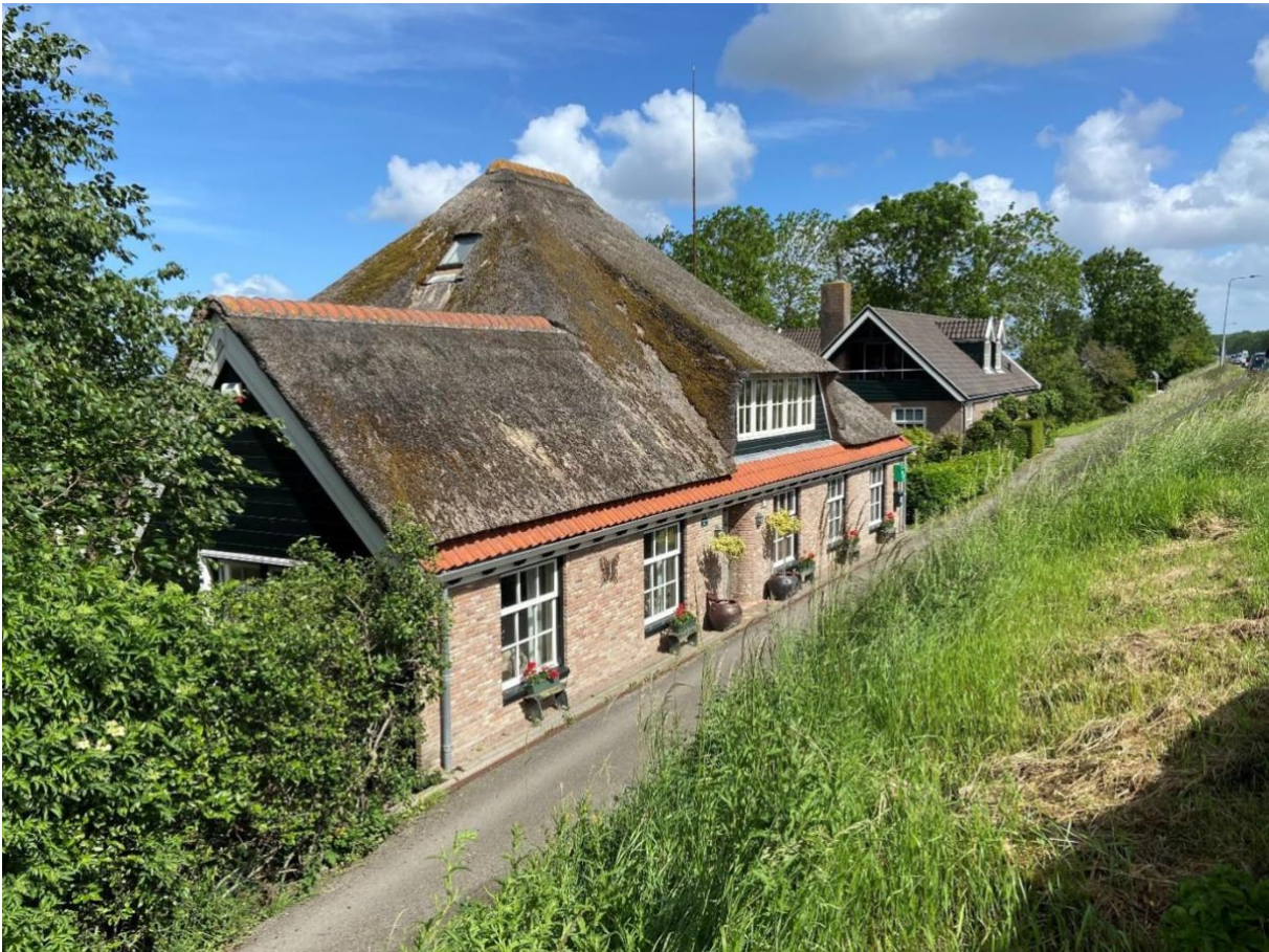
De stolpboerderij in zijn omgeving, gezien in noordwestelijke richting.