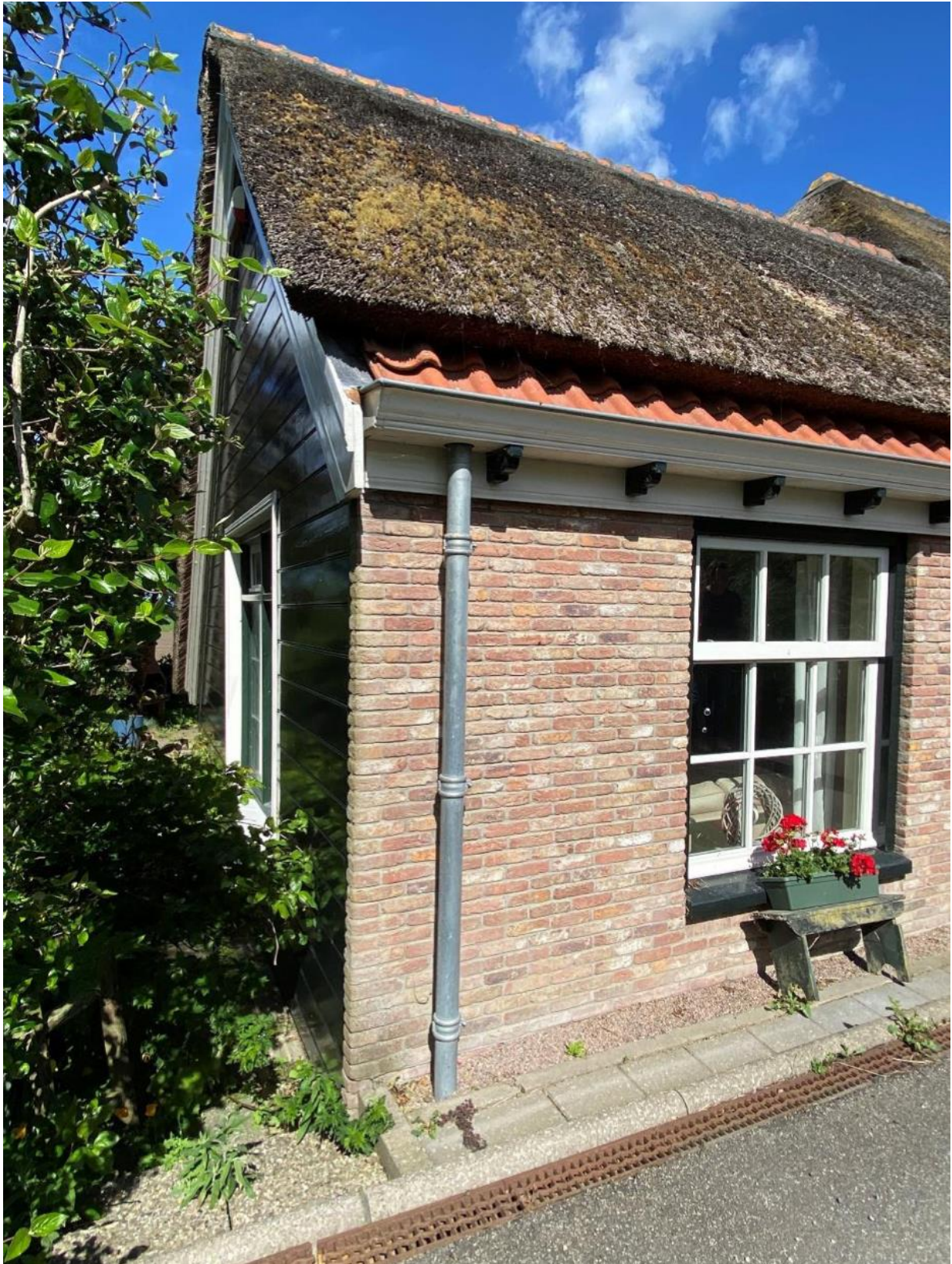
Linkerzijgevel en kopgevel van het staartstuk.