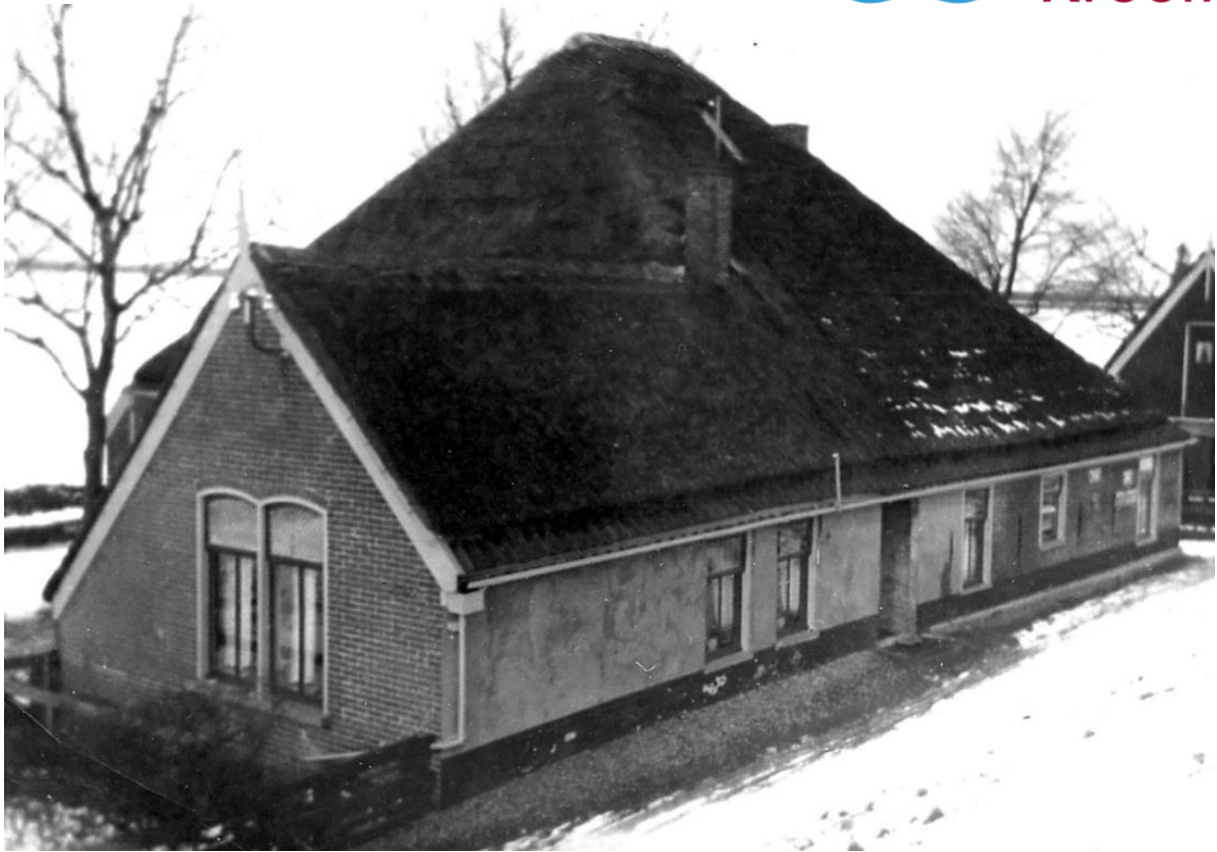
Historische foto uit 1935. De oostgevel is inmiddels voorzien van pleisterwerk en er is een portiek aangebracht.