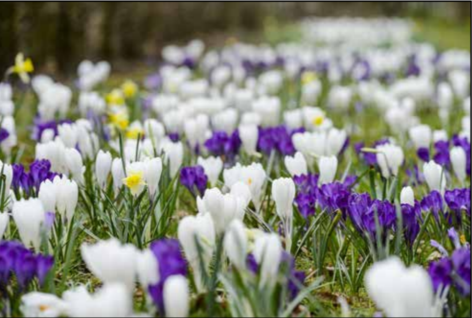
Vlekken / ovalen met verwilderingbollen toepassen