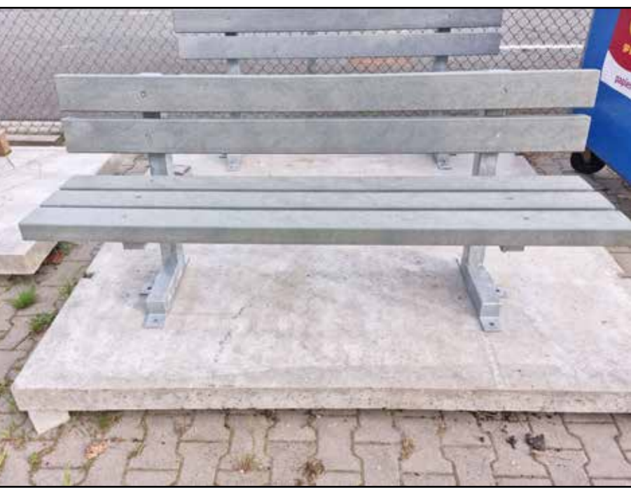
Voorbeeld standaard toe te passe bankje binnen de gemeente