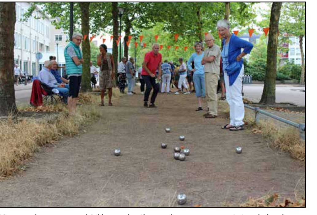
Het ovaal van graustabiel kan gebruikt worden voor een potje jeu de boules