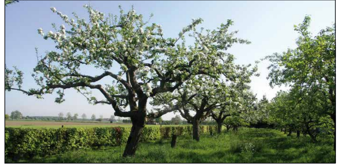
In het plantsoen enkele hoogstamfruibomen toepassen