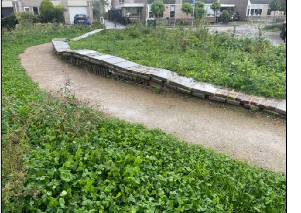
Voorbeeld van een natuurlijke zitmuur in 't Veld