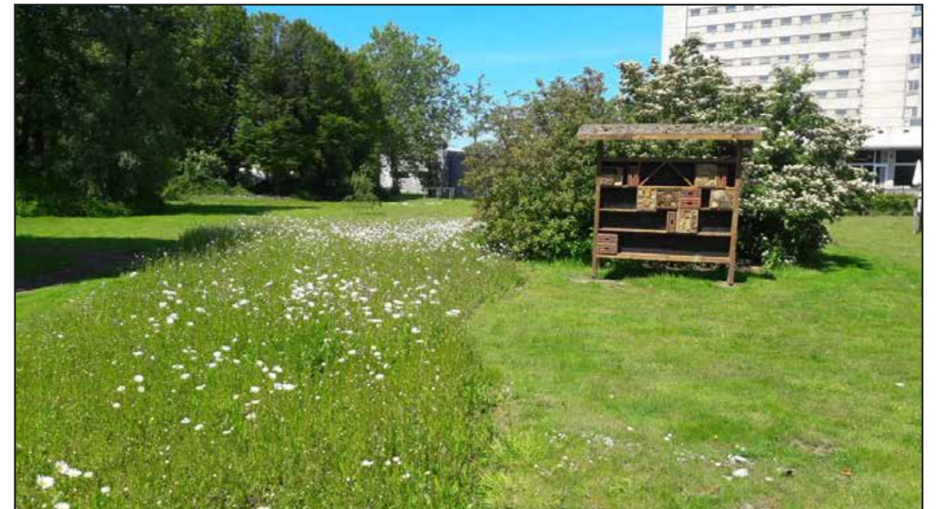
Referentiebeeld van de beoogde situatie (verschil in maalfrequentie)