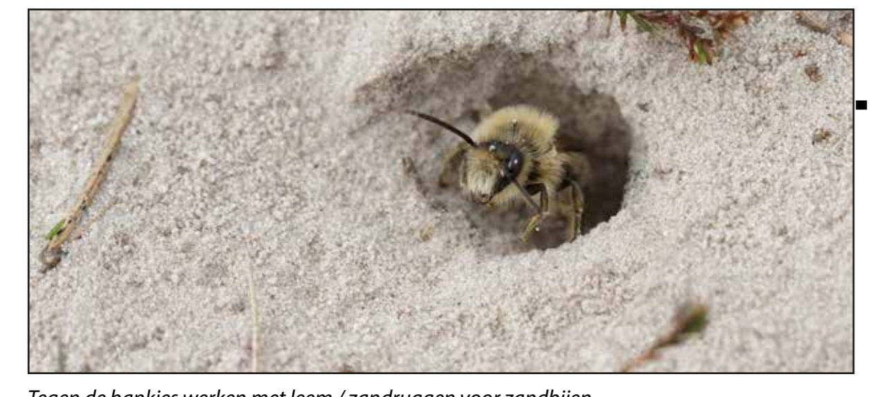
Tegen de bankjes werken met leem / zandruigen voor zandbijen