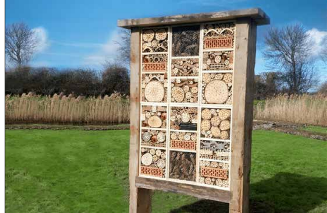
Optioneel insectenhots plaatsen