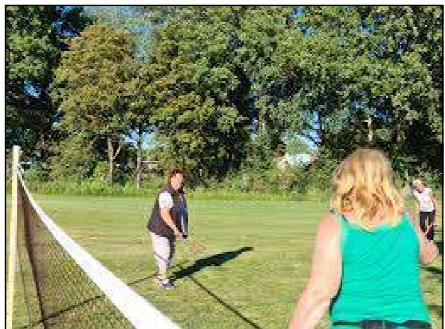
Het strakke gazon kan gebruikt worden om een balletje te trappen of een potje badminton te spelen