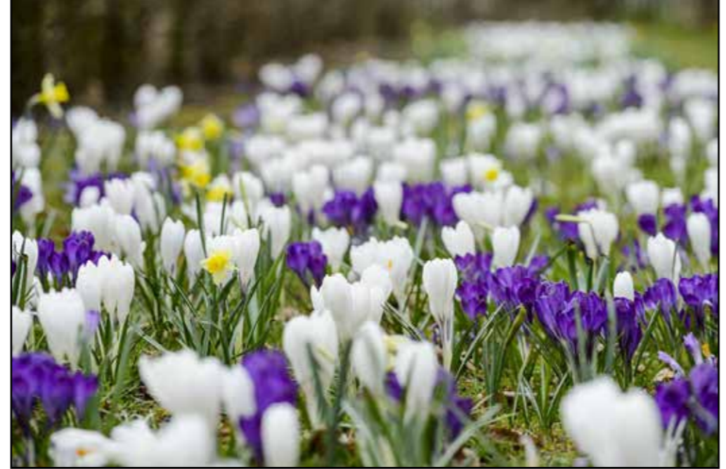
Vlekken / ovalen met verwilderingbollen toepassen