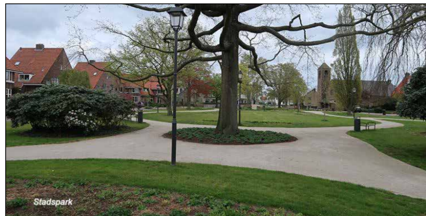
Halfverhard pad van Graustabiel toepassen voor een parkachtig karakter (paden zijn 150 cm breed in het ontwerp en daarmee smaller dan dit voorbeeld)