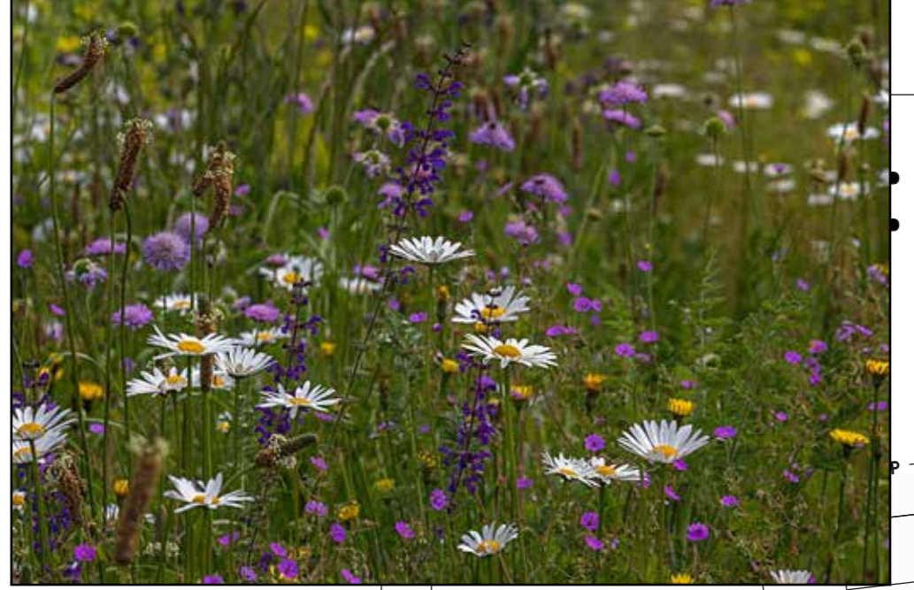
Voorbeeld van het zogenaamd bloemenmengsel N1