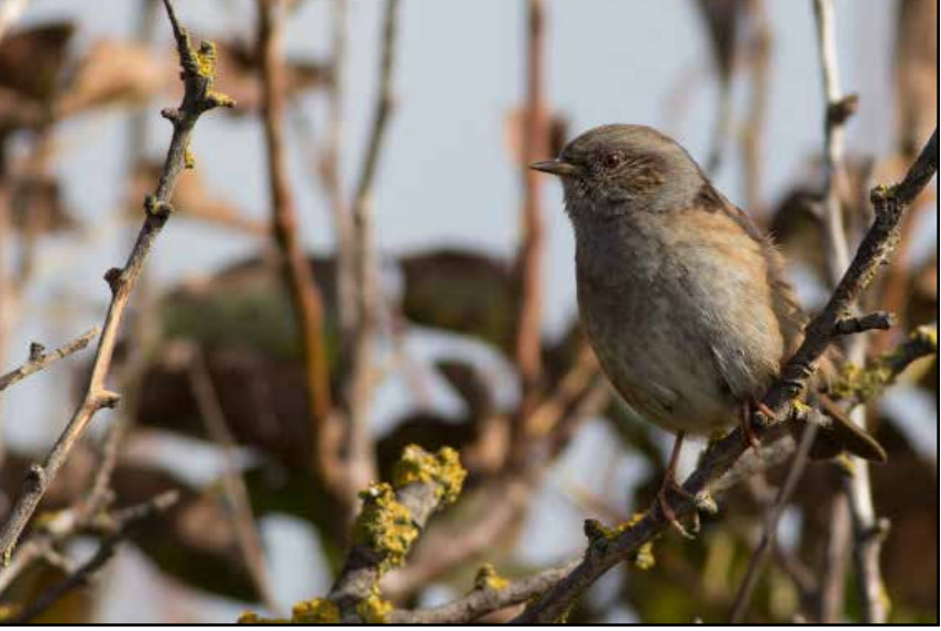
De diverse beplantingen zullen insecten en daarmee ook vogels aantrekken