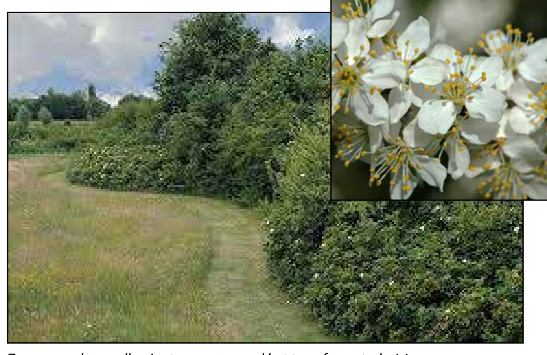
Zogenaamde vogelbosjes toepassen rond het transformatorhuisje