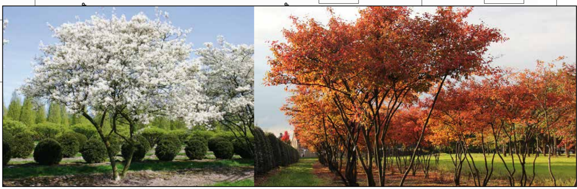
Meersammige solitairen met seizoenskenmerken toepassen; deze blijven laag zodat ze de zonnepanelen niet in de weg zitten