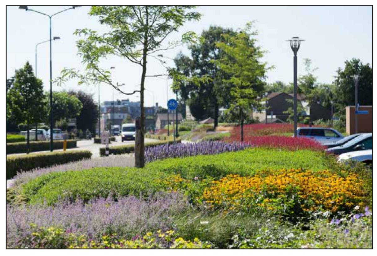
Op de koppen werken met sterke vaste planten (aansluiten bij assortiment Sweco)