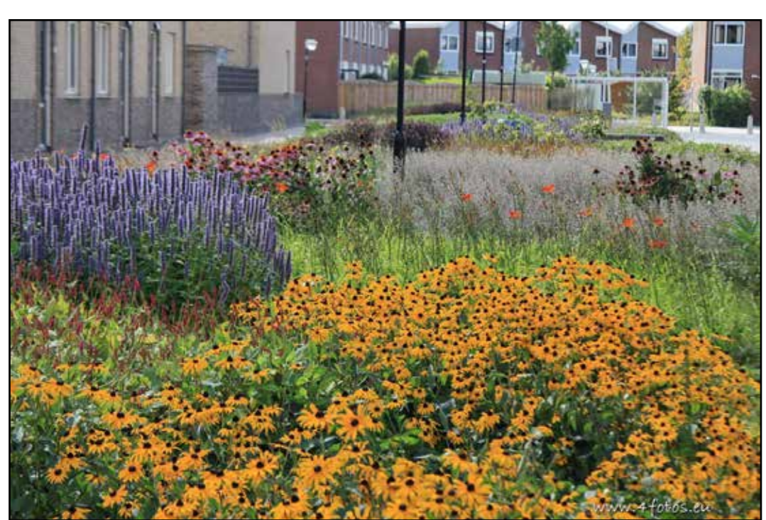
Gebruik van sterke vaste planten op enkele koppen en zichtpunten z