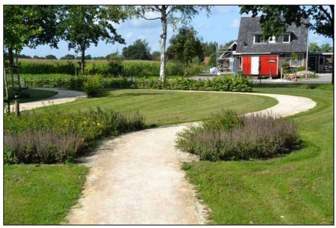
Halfverhard pad dat door het plantsoen meandert (parkachtig beeld)