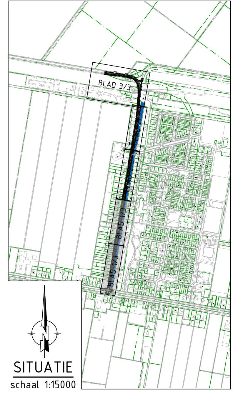
SITUATIE schaal 1:15000

VOOR AANSLUITING ZIE TEKENINGNR. 23HB004-1-NS-001-2