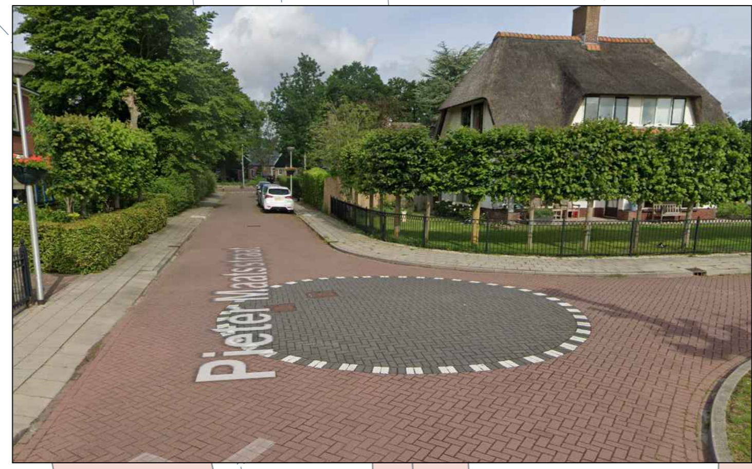
REFERENTIE BEELD (punaise) Pieter Maatsstraat Hippolytushoef